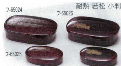
溜 刷毛目 小判