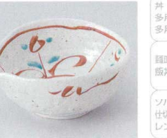
11560-036 650円 手描万葉片口3.5鉢(110×90×50mm) 11561-036 900円 手描万葉4.0片口鉢(140×115×65mm)