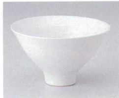
11501-336 550円 白マルーカボ-ルス(100×60mm) 11502-336 900円 白マルーカボ-ルスM(127×72mm) 11503-336 1,350円 白マルーカボ-ルスL(142×83mm)