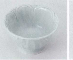
11526-226 960円 益子梅型3.5小鉢(104×65mm) 11527-226 1,120円 益子梅型4.0小鉢(124×72mm)