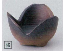
11522-416 760円 黒彩三葉小鉢(小)(80×50mm) 11523-416 1,160円 黒彩三葉小鉢(大)(100×73mm)