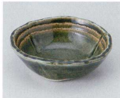
11552-326 680円 織部ライン3.5鉢(118×112×33mm) 11553-326 980円 織部ライン4.0鉢(130×130×37mm)