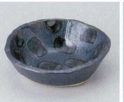
11554-316 650円 黒斑点変型3.5鉢(φ117×36mm) 11555-316 930円 黒斑点変型4.5鉢(φ134×43mm)