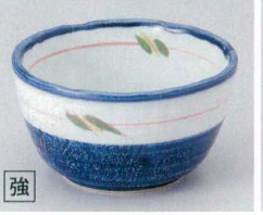
11544-166 820円 たんざく紋3.6小鉢(107×60mm) 11545-166 1,040円 たんざく紋4.0小鉢(120×67mm)