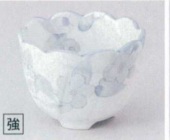
11514-076 1,100円 さがのねじり型珍珠(75×55mm) 11515-076 1,250円 さがのねじり型小鉢(90×65mm)