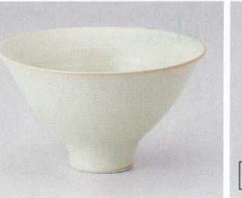
11506-386 870円 ジャパネスクモダンMグリーン(125×73mm) 11507-386 1,300円 ジャパネスクモダンLグリーン(140×82mm)