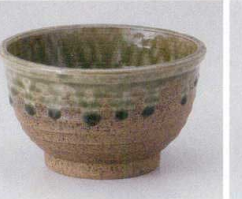
11516-456 950円 灰袖荒土夏目3.3井(103×62mm) 11517-456 1,200円 灰袖荒土夏目3.8井(115×68mm)