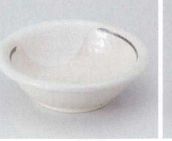
11546-416 600円 カイラギサビライン3.8鉢(110×40mm) 11547-416 1,020円 カイラギサビライン4.5鉢(140×43mm)