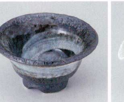
11558-306 710円 渦潮丸小鉢(105×53mm) 11559-306 920円 渦潮4.0小鉢(125×65mm)