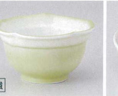
11508-416 1,080円 ヒワ吹輪花3.0小鉢(93×50mm) 11509-416 1,300円 ヒワ吹輪花3.8小鉢(110×60mm)