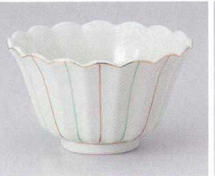
11504-416 1,020円 京十草菊形2.7鉢(80×65mm) 11505-416 1,320円 京十草菊形3.6鉢(110×65mm)