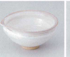
11556-076 700円 白粉引片口小鉢(小)(108×105×60mm) 11557-076 920円 白粉引片口小鉢(大)(132×125×65mm)