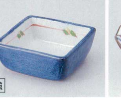
11538-166 590円 たんざく紋3.0角小付(78×78×33mm) 11539-166 1,060円 たんざく紋4.0角小鉢(106×106×43mm)