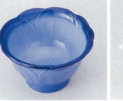
11528-226 960円 濃コバルト3.5小鉢(104×65mm) 11529-226 1,120円 濃コバルト4.0小鉢(124×72mm)