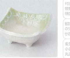
11530-416 800円 カコメヒワ吹角3.0小鉢(87×45mm) 11531-416 1,100円 カコメヒワ吹角4.0小鉢(110×45mm)