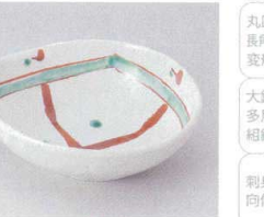
11510-176 1,200円 手描き菱紋精肉小鉢(120×100×40mm) 11511-176 1,280円 手描き菱紋精肉中鉢(155×130×55mm)