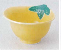
11534-416 840円 なす黄交趾3.0鉢(90×53mm) 11535-416 1,080円 なす黄交趾3.6鉢(110×63mm)