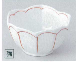
11542-406 800円 桔梗型赤筋小鉢(小)(82×48mm) 11543-406 1,050円 桔梗型赤筋小鉢(大)(100×56mm)