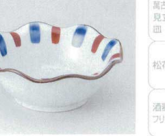
11540-026 920円 手描間取赤十草花型3.6小鉢(110×43mm) 11541-026 1,050円 手描間取赤十草花型4.0小鉢(121×45mm)