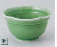
11524-416 1,050円 輪花3.3小鉢ヒワ(95×50mm) 11525-416 1,160円 輪花3.8小鉢ヒワ(110×60mm)