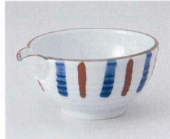
11512-026 980円 手描間取赤十草片口小付(104×92×47mm) 11513-026 1,270円 手描間取赤十草片口小鉢(130×115×60mm)