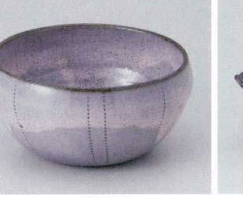
11548-216 840円 ピンク十草くくりボール(小)(98×52mm) 11549-216 1,000円 ピンク十草くくりボール(大)(112×55mm)