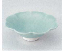
11532-186 1,000円 亀甲青地輪花4.0鉢(122×48mm) 11533-186 1,100円 亀甲青地輪花4.8鉢(145×47mm)