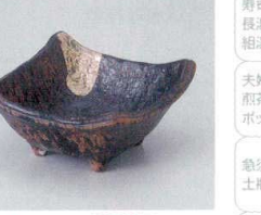
11550-326 630円 金風3.3小鉢(85×52mm) 11551-326 980円 金風4.0小鉢(105×50mm)