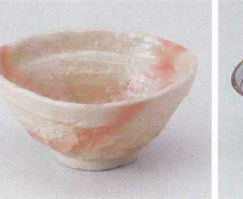
11518-136 1,100円 火だすき三角3.6小付(107×105×50mm) 11519-136 1,180円 火だすき4.0小鉢(120×115×55mm)