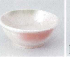
11536-326 820円 彩時空・虹片口3.6鉢(112×110×43mm) 11537-326 1,080円 彩時空・虹片口4.0鉢(124×120×50mm)