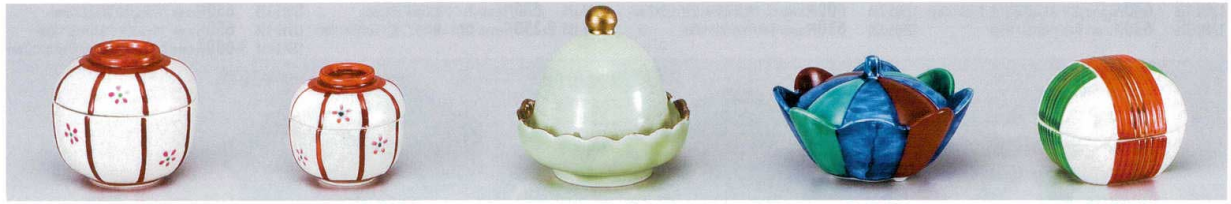
13006-226 2,660円 252208207 ポンポリ蓋付珍珠(大) (65×58mm) 13007-226 2,230円 252208208 ポンポリ蓋付珍珠(小) (50×46mm) 13008-186 2,400円 251808317 若草金彩つり金型珍珠 (78×76mm) 13009-186 2,300円 251808319 交趾菊割珍珠 (90×55mm) 13010-086 2,250円 250808226 糸巻角珍珠 (60×60×65mm)