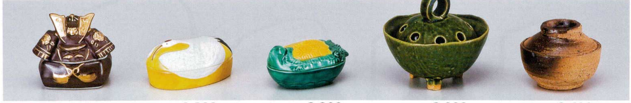
13001-226 3,500円 252208303 兜珍珠 (65×65×68mm) 13002-406 3,200円 254008301 黄文跡鶴蓋付珍珠 (82×56×40mm) 13003-406 3,200円 254008302 黄色亀蓋付珍珠 (78×54×40mm) 13004-086 2,900円 260813004 織部珍珠 (85×75mm) 13005-336 2,600円 253308338 焼締蓋付珍珠 (70×50mm)