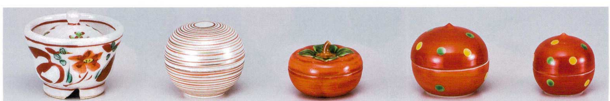
13026-456 1,900円 254508203 志野赤絵蓋付珍珠 (83×60mm) 13027-406 1,780円 254008220 朱金コマ筋蓋付珍珠 (65×60mm) 13028-106 1,750円 251008333 柿珍珠赤 (62×40mm) 13029-126 1,750円 251208209 朱巻水玉蓋珍珠(大) (65×60mm) 13030-126 1,600円 251208210 朱巻水玉蓋珍珠(小) (50×50mm)