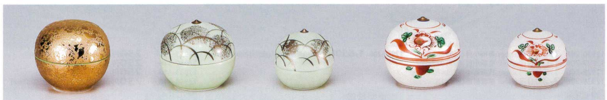
13016-226 2,020円 252208219 金箔手まり珍珠 (63×53mm) 13017-056 1,900円 250508215 グリーン芦珍珠(大) (65×55mm) 13018-056 1,600円 250508216 グリーン芦珍珠(小) (50×45mm) 13019-056 1,900円 250508213 赤絵花珍珠(大) (65×55mm) 13020-056 1,600円 250508214 赤絵花珍珠(小) (50×45mm)