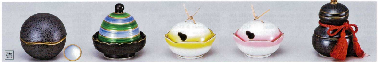
13011-316 2,170円 253108225 外結晶釉梅型蓋物ブルー (65×62mm) 13012-186 2,200円 251808318 つり金型駒筋珍珠 (75×75mm) 13013-336 2,000円 253308315 瓢抜イエロー蓋付珍珠 (70×30mm) 13014-336 2,000円 253308316 瓢抜ピンク蓋付珍珠 (70×30mm) 13015-226 2,070円 252208206 黒結晶瓢型二段珍珠 (57×80mm)