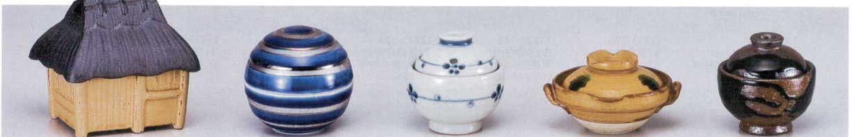
13116-106 1,100円 251008205 家型珍珠入 (90×73×90mm)