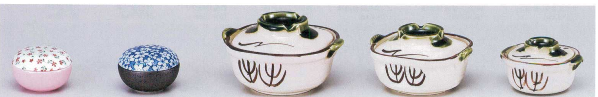
13126-406 550円 254008241 プチフラワー蓋付珍珠 (50×35mm)