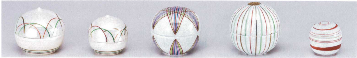
13101-126 1,600円 251208211 ラスターすずき蓋珍珠(大) (65×60mm)