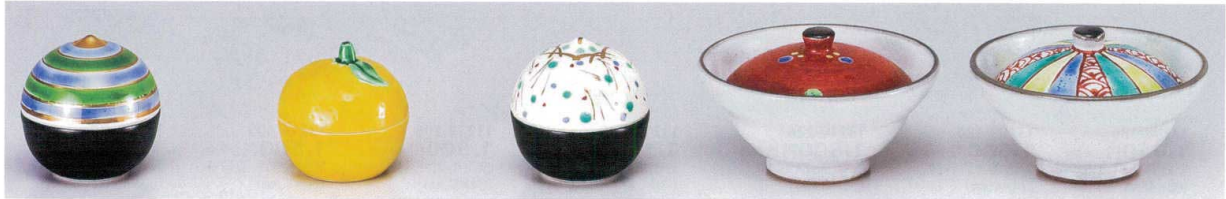
13106-136 1,500円 251308233 駒筋珍珠 (50×50mm)