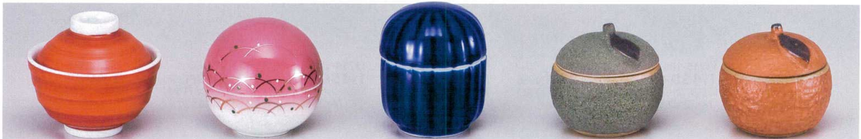
13111-156 1,340円 251508336 筋蓋物赤 (76×66mm)