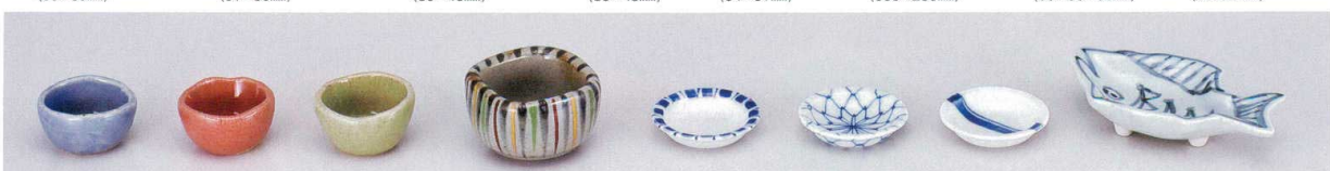
13550-086 500円 253080813 ブルー珍珠小 (45×25mm) 13551-086 500円 253080815 ピンク珍珠小 (45×25mm) 13552-086 500円 253080814 グリーン珍珠小 (45×25mm) 13553-126 500円 251208617 粉引色入十草珍珠 (54×54×36mm) 13554-156 500円 261513554 太十草豆皿 (48×11mm) 13555-156 630円 261513555 アミ豆皿 (48×11mm) 13556-156 500円 261513556 ポーダーライン豆皿 (48×11mm) 13557-156 490円 251509009 魚形珍珠 (110×60×25mm)