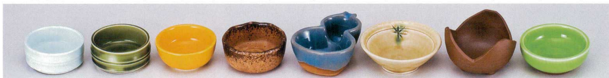
13517-406 580円 264013517 青磁竹節珍珠 (65×30mm) 13518-406 580円 254013518 織部竹節珍珠 (65×30mm) 13519-076 580円 250709125 黄釉丸千代口 (64×28mm) 13520-036 580円 250308543 信楽風千代口 (70×32mm) 13521-156 570円 251553310 亀甲青磁七サコ形小鉢(小) (98×70×35mm) 13522-056 570円 250008857 伊良保珍珠 (85×30mm) 13523-186 560円 251808524 南蛮三ツ山珍珠 (75×50mm) 13524-156 550円 251509123 緑釉千代口 (75×30mm)