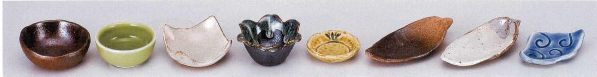
13501-406 600円 254008517 焼締丸豆鉢 (77×30mm) 13502-076 600円 250709126 天龍寺丸千代口 (64×28mm) 13503-406 600円 254008533 粉引四方豆鉢 (75×25mm) 13504-416 600円 254108512 ブルー鉄釉花珍珠 (75×38mm) 13505-316 600円 263113505 砂黄瀬戸豆皿 (φ60×18mm) 13506-186 600円 251808908 手造り備前笹形珍珠 (120×60×27mm) 13507-186 600円 261813507 手造り粉引笹型珍珠 (125×60×27mm) 13508-186 600円 261813508 青釉雲形箸置珍珠 (89×56×18mm)