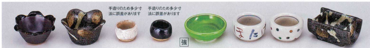
13509-416 600円 254108510 鉄砂花珍珠 (75×38mm) 13510-256 580円 252508518 雲金梅珍珠 (78×42mm) 13511-406 590円 254008612 鉄粉引珍珠 (39×25mm) 13512-406 590円 254008611 黒釉珍珠 (39×25mm) 13513-316 590円 263113513 緑釉丸珍珠 (φ75×26mm) 13514-406 580円 254008619 いろは碗型珍珠 (60×37mm) 13515-406 580円 254008620 水玉碗型珍珠 (60×37mm) 13516-256 580円 252508519 雲金竹珍珠 (82×56×42mm)