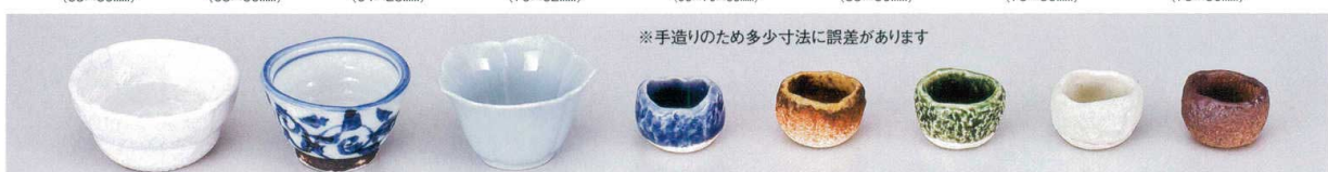
※手造りのため多少寸法に誤差があります 13525-316 540円 253108938 小雪珍珠 (80×39mm) 13526-306 540円 263013526 流唐草 珍珠 (70×43mm) 13527-256 370円 2520848 青白桔梗珍珠(小) (60×40mm) 13528-256 530円 2520849 青白桔梗珍珠(大) (80×55mm) 13529-336 550円 263313529 ツボ型藍釉珍珠 (約40×40×35mm) 13530-336 550円 263313530 ツボ型伊良保珍珠 (約40×40×35mm) 13531-336 550円 263313531 ツボ型織部珍珠 (約40×40×35mm) 13532-336 550円 263313532 ツボ型白釉珍珠 (約40×40×35mm) 13533-336 550円 263313533 ツボ型鉄釉珍珠 (約40×40×35mm)