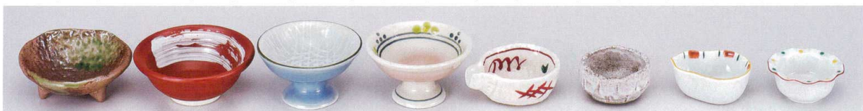
13542-336 500円 253308855 織部若清水三ツ足珍珠 (90×35mm) 13543-316 500円 253109002 朱白刷毛リム3.0千代口 (91×36mm) 13544-326 500円 253208821 白刷毛目高台珍珠 (80×46mm) 13545-326 500円 253208825 早春高台珍珠 (80×45mm) 13546-026 520円 25008527 手描赤絵片口珍珠 (64×31mm) 13547-206 500円 252008616 灰白亀甲手押し珍珠 (560×280mm) 13548-336 500円 253308650 赤絵十草瓢型珍珠 (63×50×30mm) 13549-336 500円 253308649 赤絵波型珍珠 (58×27mm)