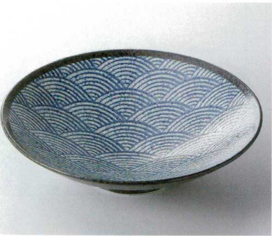
01416-476 1,450円 254719918 青海波9.0盛鉢(283×75mm)