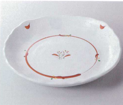
01404-176 2,200円 261701404 赤絵丸紋10.0皿(287×43mm)