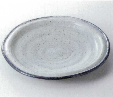
01402-306 1,550円 263001402 澗コス青オフケ玉澗バスタ皿(255×35mm) 01403-306 2,400円 263001403 澗コス青オフケ玉澗大皿(290×35mm)