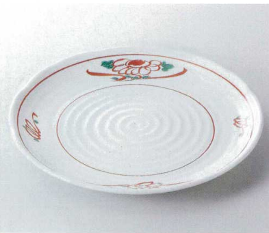
01419-066 1,450円 250619917 粉引手描赤絵10.0皿(295×30mm)