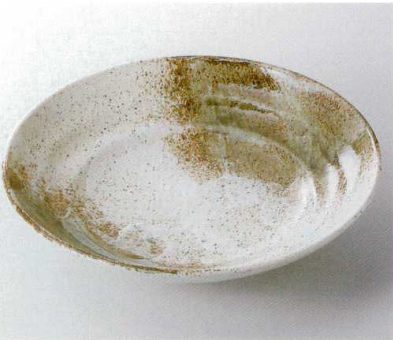
01410-476 620円 254719913 雪志野7.5麵皿(228×50mm) 01411-476 1,450円 254719914 雪志野9.5盛皿(285×60mm)