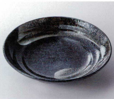
01414-476 620円 254719915 荒ハケ7.5麵皿(228×50mm) 01415-476 1,450円 254719916 荒ハケ9.5盛皿(285×60mm)