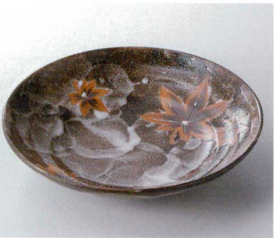
01417-476 620円 254719911 ネズミ志野楓7.5麵皿(228×50mm) 01418-476 1,450円 254719912 ネズミ志野楓9.5盛皿(285×60mm)