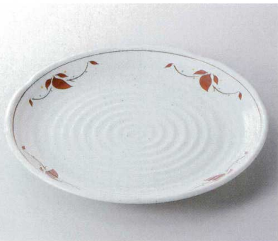
01406-276 970円 252719519 赤絵花8.0皿(245×30mm) 01407-276 1,900円 252719520 赤絵花10.0皿(300×33mm)