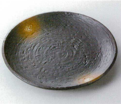
01401-476 2,500円 264701401 備前丸9.0皿(280×30mm)