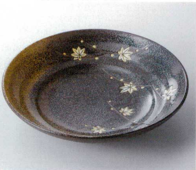
01412-476 620円 254719909 錦吹もみじ7.5麵皿(228×50mm) 01413-476 1,450円 254719910 錦吹もみじ9.5盛皿(285×60mm)