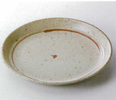
01405-086 2,000円 250819109 唐津一本線9.0浅皿(275×36mm)