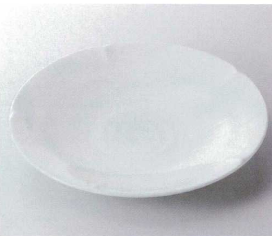
01408-386 610円 263801408 湖水8寸深皿(242×47mm) 01409-386 1,460円 263801409 湖水9.7大皿(292×34mm)