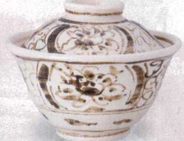
14216-406 4,000円 264014216 乾山風蓋物碗 (128×102mm)