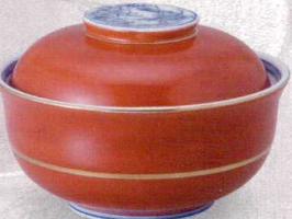
14220-126 3,900円 251210013 赤吹松竹梅円菓子碗 (125×90mm)