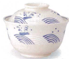
14207-216 4,700円 252109407 仁清青海波反小蓋向 (102×80mm)