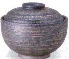
14217-316 4,000円 263114217 金彩雲菓子碗 (φ108×84mm)