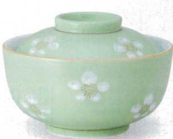
14214-126 4,150円 251209801 ヒワ白梅円菓子 (120×83mm)