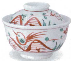
14213-406 4,200円 254009408 花鳥小蓋物 (110×90mm)