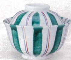
14215-406 4,000円 254009411 緑交趾十草小蓋物 (110×85mm)