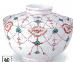
強 14211-306 4,320円 253009409 瓔瑠紋蓋向 (110×85mm)