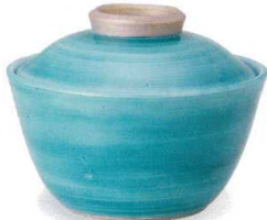
14209-406 4,500円 254009405 緑交趾蓋物 (110×80mm)