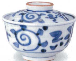
14210-226 4,470円 262214210 新蓋物染付唐草 (112×90mm)