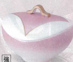
強 14219-036 4,000円 260314219 ピンク吹七宝紋蓋物 (112×86mm)