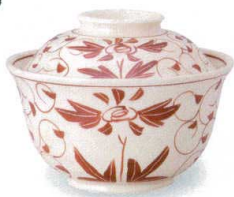
14206-216 4,700円 252109406 仁清赤花反小蓋向 (102×80mm)