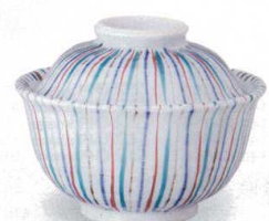
14212-216 4,300円 252109410 色十草反小蓋向 (110×85mm)