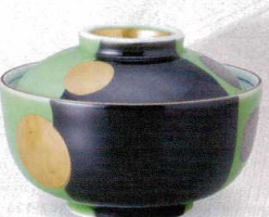
14218-186 4,000円 251809510 ヒワ黒金銀丸紋円菓子碗 (120×85mm)