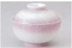
14422-186 3,000円 251809521 ピンク白吹煮物碗(115×95mm)