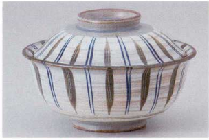
14406-126 3,250円 251209705 粉引二色十草小蓋向(120×80mm)