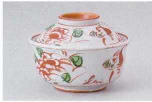
14409-216 3,200円 251109604 赤絵万暦ミニ蓋向(100×72mm)