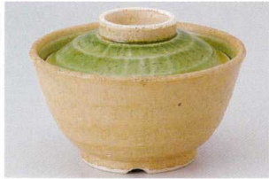
14413-116 3,200円 251109613 内織部円菓子碗(127×91mm)