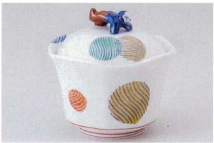
14418-186 3,200円 261814418 江戸小紋閑人蓋物(105×105×105mm)