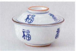
14423-216 3,000円 252109603 カイラギ呉須文字ミニ蓋向(100×72mm)