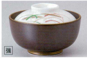
14404-086 3,300円 250809807 安曇野円菓子碗(120×95mm)