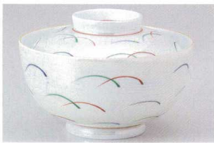
14421-126 3,000円 251209524 ラスターむさしの円菓子(117×80mm)