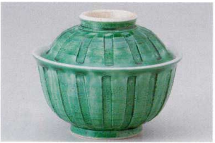
14411-406 3,200円 254009703 緑交跡小蓋物(112×85mm)