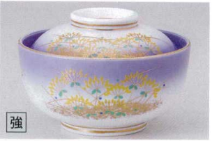
14403-086 3,300円 250809523 加茂川円菓子碗(118×95mm)