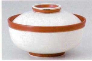
14401-126 3,350円 251210018 赤玉淵刷小蓋向(123×78mm)