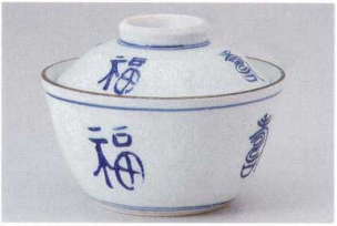
14407-406 3,200円 254009420 桜皮福小蓋物(110×85mm)