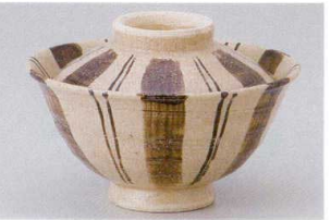
14416-406 3,200円 254014416 錆十草反蓋付碗(120×82mm)