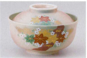
14419-226 3,190円 262214419 錦春秋円菓子碗(120×85mm)