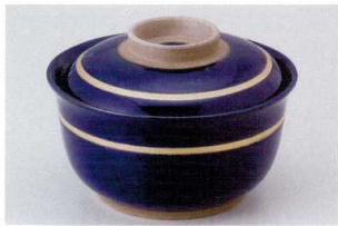
14417-416 3,500円 254110121 ルリ金蓋付碗(125×90mm)