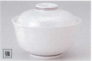
14414-336 3,200円 253309708 錦花円菓子碗(115×75mm)