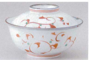
14424-336 3,000円 263314424 赤絵唐草円菓子碗(115×75mm)