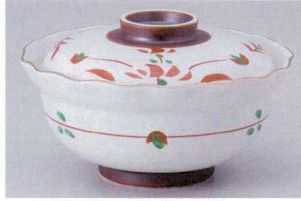
14603-056 2,450円 250509827 花型はなやぎ円菓子碗(大)(140×80mm)