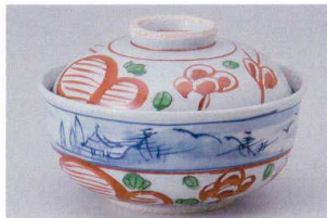
14618-336 2,250円 253309823 赤絵山水水円菓子碗(大)(130×90mm)