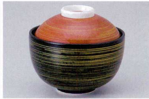
14612-316 2,350円 253109716 朱黒金ハケ玉型菓子碗(106×97mm)