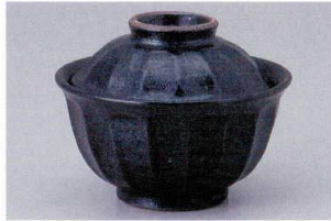
14607-456 2,400円 264514607 黒柚子蓋物(110×84mm)