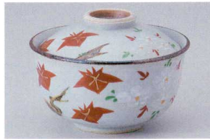
14609-336 2,350円 253309822 乾山写雲錦円菓子碗(小)(120×88mm)