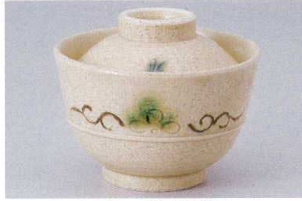
14602-456 2,480円 254509617 黄瀬戸花彫円菓子碗(110×90mm)