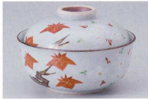
14610-336 2,350円 253309821 乾山写雲錦円菓子碗(大)(130×88mm)