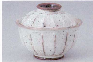
14606-456 2,400円 254509620 粉引鉄彩蓋物(110×88mm)