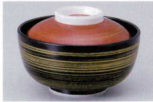
14611-316 2,350円 253109715 朱黒金ハケ菓子碗(116×77mm)