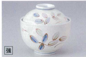
14604-086 2,400円 250848758 清里円菓子碗(120×79mm)