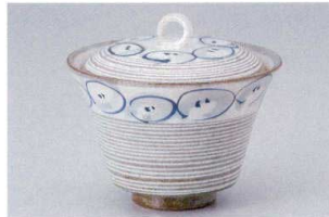
14613-186 2,350円 261814613 粉引削りコス絵蓋物(115×102mm)