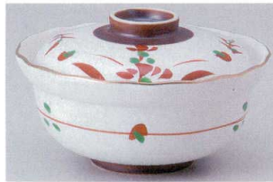
14623-056 2,200円 250509828 花型はなやぎ円菓子碗(小)(120×65mm)