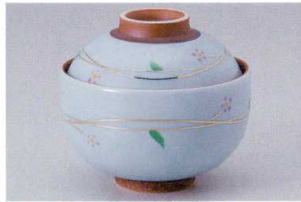
14625-126 2,100円 251209626 茶淵青磁小花円菓子(小)(97×90mm)