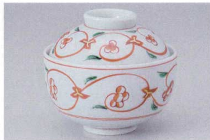
14620-126 2,000円 251209628 錦唐草円菓子(小)(97×88mm)