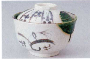
14601-126 2,500円 251248711 織部煮物碗(120×95mm)