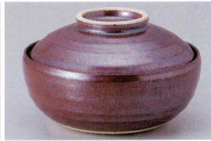
14627-156 2,150円 251509719 くれない平形円菓子(120×75mm)