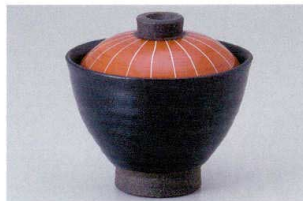
14617-086 2,300円 25089901 赤絵フタ付煮物碗(107×100mm)