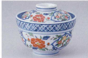
14615-186 2,350円 251809817 花唐草煮物碗(125×80mm)