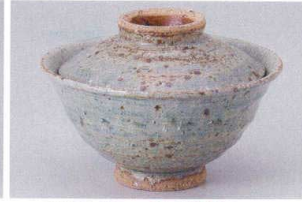
14703-456 2,100円 254509905 灰釉鉄彩蓋物(122×82mm)