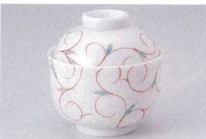
14721-216 1,600円 252109909 唐草丸円菓子碗(98×100mm)