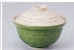
14714-316 1,710円 263114714 グリーン渦福碗(φ108×85mm)