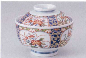
14716-316 1,800円 251109918 錦草花円菓子碗(126×103mm)