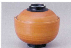
14723-056 1,530円 260514723 外朱中白円菓子碗(小)(100×90mm) 14724-056 1,580円 260514724 外朱中白円菓子碗(大)(110×100mm)