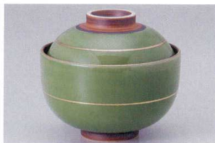
14717-336 1,750円 253309723 萌黄金筋円菓子碗(110×100mm)