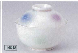
14706-286 2,100円 252809820 二本線反小蓋物(115×75mm)