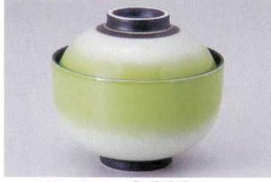
14701-056 2,300円 250509722 ヒワ吹円菓子碗(大)(110×100mm)