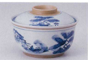
14726-316 1,500円 253109925 古染山水菓子碗(130×86mm)