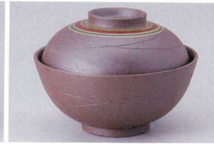
14704-306 2,100円 255009902 南蛮駒筋円菓子碗(123×88mm)