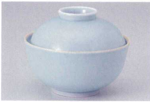
14711-186 2,000円 251809904 袖裏紅青磁円菓子碗(114×90mm)