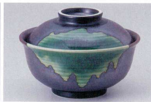
14713-126 2,000円 251210124 鉄砂織部塗蓋付(130×87mm)