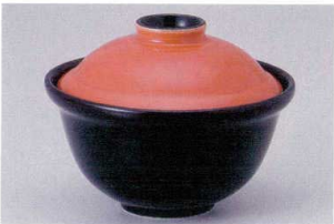
14715-316 1,910円 263114715 塗分赤黒福碗(φ108×85mm)