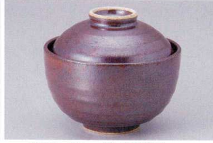
14702-156 2,150円 251509720 くれない玉形円菓子(111×98mm)