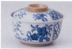
14712-416 2,000円 254109924 新花鳥蓋付碗(130×86mm)