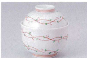
14722-216 1,600円 252109910 手描きつる草丸円菓子碗(98×100mm)