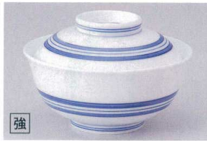
14705-326 2,100円 263214705 一珍青花円菓子碗(123×10mm)