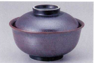
14719-056 1,500円 260514719 鉄砂反型円菓子碗(小)(110×80mm) 14720-056 1,700円 250509907 鉄砂反型円菓子碗(大)(130×85mm)