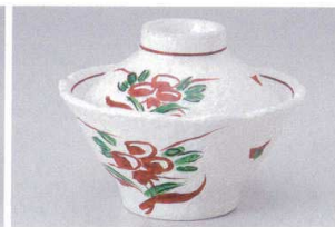
14710-186 2,050円 251809908 粉引|赤絵花煮物碗(129×93mm)