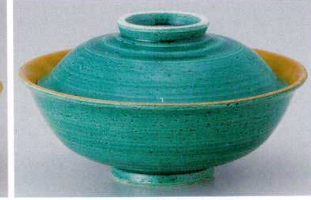
14820-186 3,800円 251810103 アメ軸交趾煮物碗(138×80mm)