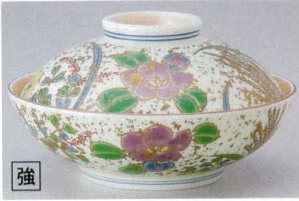
14805-336 4,350円 253310201 ヒスイ金筋反蓋向(135×95mm)