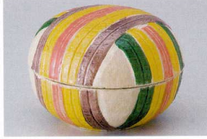
14807-086 4,200円 250810002 荒土糸巻蓋物(120×98mm)