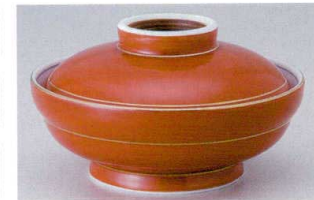
14817-126 3,800円 251210209 朱巻中蓋向(155×90mm)