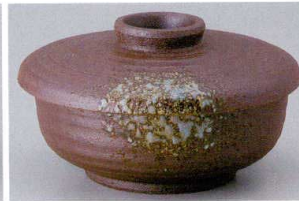
14822-186 3,700円 251810021 南蛮灰かぶし金タタキ蓋物(132×77mm)