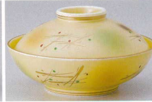
14819-086 3,800円 260814819 みちの<蓋向(133×87mm)