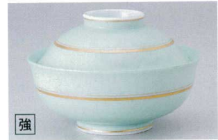
14804-316 4,540円 253110213 赤巻唐草平蓋向(167×90mm)