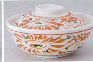
14823-306 3,700円 253010116 赤絵花唐草煮物碗(137×70mm)