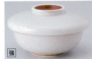
14812-166 3,850円 251610108 ベージュ蓋物(123×75mm)