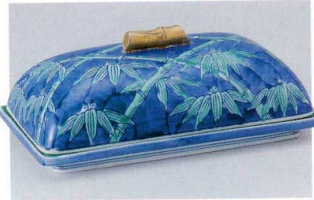
14801-186 7,300円 251810001 青交趾竹長角蓋向(203×113×85mm)