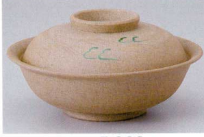
14803-186 5,200円 251810302 焼ノ波絵蓋向(165×93mm)