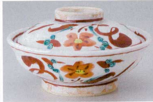
14814-456 3,800円 254510001 志野赤絵蓋向付(165×95mm)