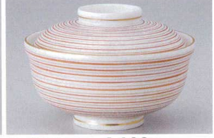
14808-406 4,100円 254010105 朱金コマジ蓋向(大)(125×84mm)