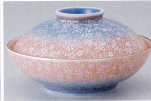
14818-336 3,800円 253310012 銀彩二色吹巻秋平蓋向(137×78mm)