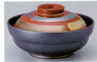
14809-126 4,100円 251210109 朱巻光輪京蓋向(143×83mm)