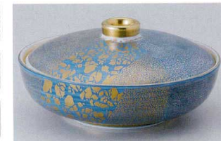
14821-186 3,750円 251810010 金銀春秋蓋向(123×63mm)