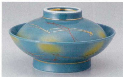
15008-056 3,500円 250510305 ヒスイ金松蓋向(165×88mm)