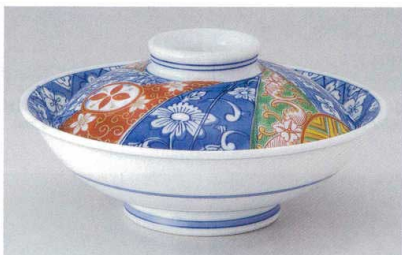
15009-186 2,300円 251810218 錦花菱5.0蓋向(158×90mm) 15010-186 2,650円 251810219 錦花菱6.0蓋向(180×88mm)