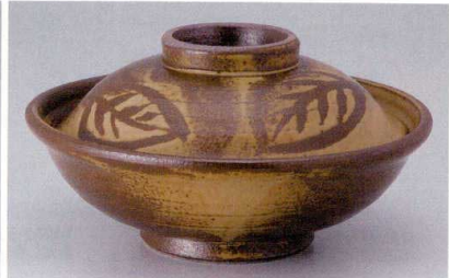
15003-086 5,000円 250810316 備前木の葉6.5蓋向(207×120mm)