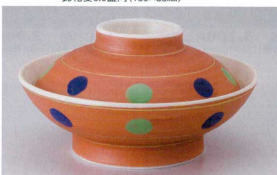
15013-056 3,800円 250510306 赤マツ点蓋向(165×88mm)