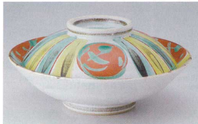
15004-136 2,800円 251310309 十草赤丸紋平蓋向(小)(163×87mm) 15005-136 4,500円 251310310 十草赤丸紋骨むし(大)(213×100mm)