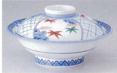
15001-316 6,050円 253110307 間取紅葉7.0骨むし(220×115mm)