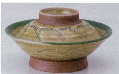
15015-336 2,200円 253354423 灰釉織部流し蓋向(165×67mm)