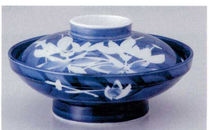
15017-306 1,600円 253010223 紺ダミ菊5.0蓋向(162×85mm)