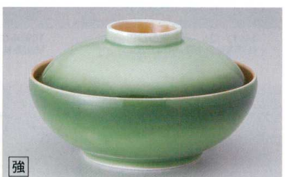
15014-326 2,450円 253210210 緑彩蓋向(148×85mm)