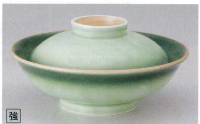
15011-316 2,580円 253110221 緑彩平蓋向(167×90mm)