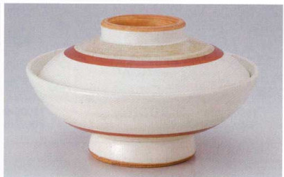
15007-086 3,100円 250810312 灰釉明日香蓋向(188×104mm)