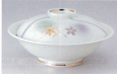
15002-086 5,300円 250810308 白吹竜田川7.0骨むし(210×116mm)