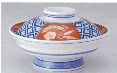
15012-186 2,500円 251810217 錦松竹梅蓋向(166×92mm)