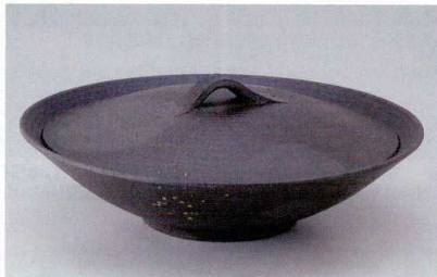
15006-076 4,300円 250710315 炭化土7.5蓋付浅丼(226×85mm)