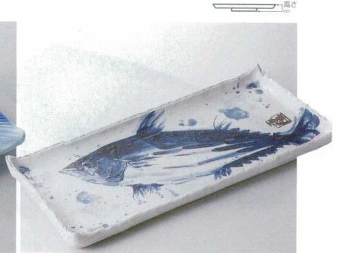
01604-306 11,000円 253021809 手造りかつお17.0盛皿(495×140×48mm)