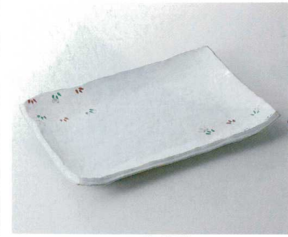
01611-416 8,400円 254122101 雪化粧長角14.0皿(360×250×40mm)