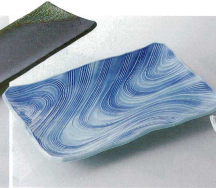
01602-306 2,500円 253021805 流水9.0長角皿(268×165×45mm) 01603-306 12,000円 253021806 流水尺四盛込皿(415×285×78mm)