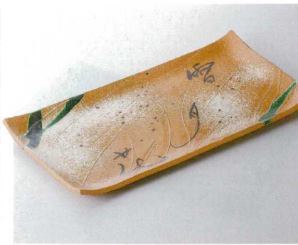
01605-036 10,000円 260301605 美濃織部雪月花長角盛皿(460×246×34mm)