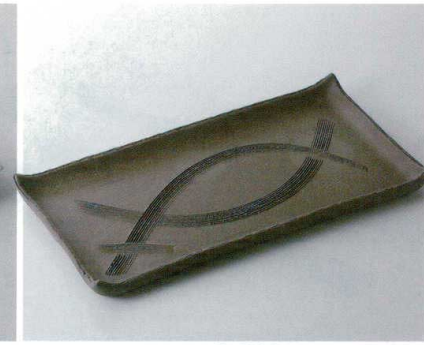
01612-306 8,300円 253022005 炭化14.0盛皿(410×210×32mm)