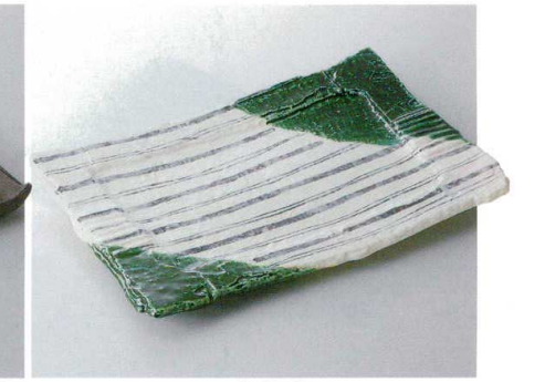
01613-186 8,200円 251821905 織部間道織尺3盛皿(395×280×37mm)