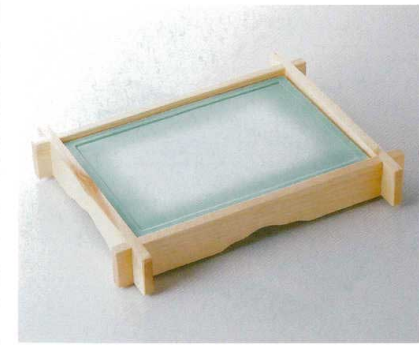
01608-126 9,000円 251221910 グリーン吹木枠付10.0盛皿(370×280×57mm)