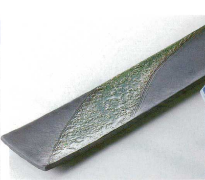
01601-356 15,000円 263501601 黒いぶし織部松川1123.0皿(700×145×35mm)