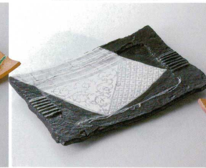
01606-476 9,200円 254721906 黒織部尺三長盛皿(280×390×37mm)