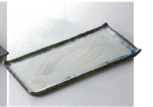
01610-136 8,400円 251321808 かいらぎ尺7盛込皿(500×240×30mm)