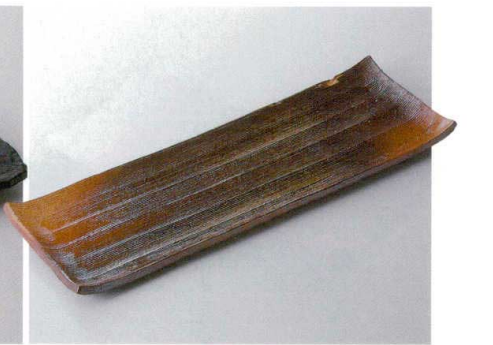
01607-186 9,100円 261801607 備前灰吹くし目長盛皿(475×160×30mm)