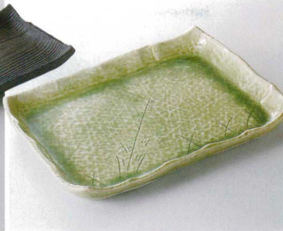
01702-156 7,600円 251522104 灰釉手彫芦長角大皿 (368×276×48mm)