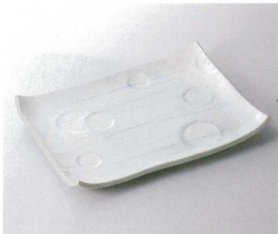
01707-286 3,800円 252822106 ストライプ中角盛皿 (262×202×25mm) 01708-286 6,500円 252822105 ストライプ長角大皿 (335×255×40mm)