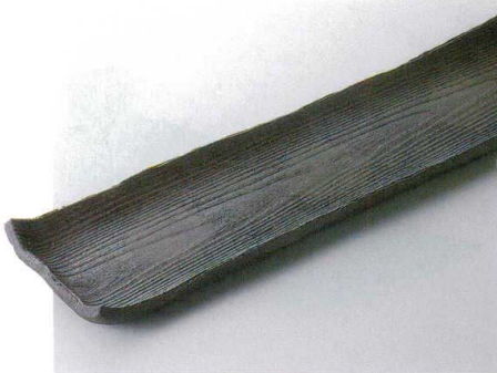
01701-306 7,700円 263001701 炭化土ボタモチ木目尺7.0皿 (527×150×35mm)