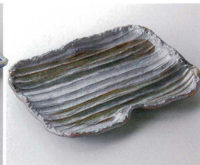
01712-356 4,600円 263501712 窯変12.0長角皿 (365×310×40mm)