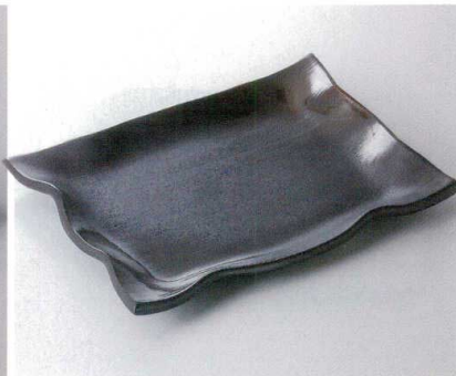
01709-316 5,100円 253122006 黒釉大皿 (410×310×50mm)