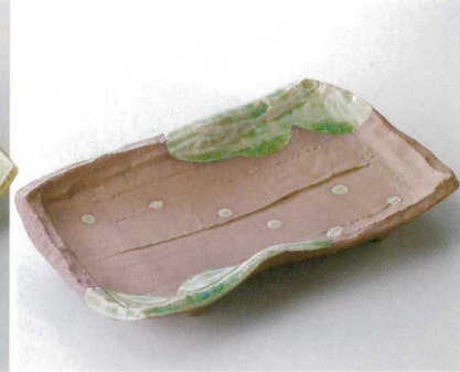
01703-186 7,500円 251822102 南蛮ビードロ流しまな板尺二皿 (357×230×60mm)