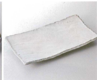
01713-136 3,800円 251321708 御本手クシ目長角尺二皿 (375×215×45mm)