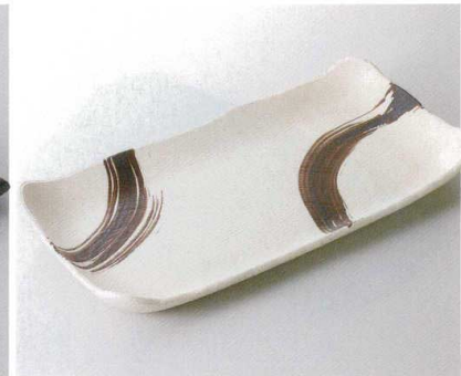
01710-026 5,190円 260201710 荒刷毛目白長角大皿 (430×230×47mm)