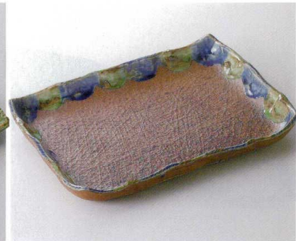
01706-326 6,700円 253222103 きらめき長角大皿 (365×275×47mm)