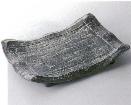
01704-086 7,000円 250822003 炭化土白化粧尺2寸盛皿 (357×245×35mm)