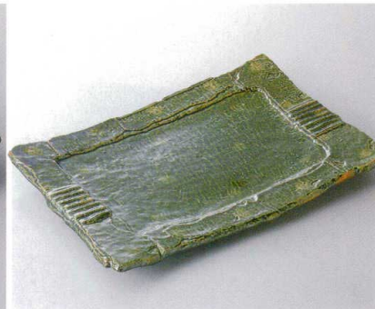
01705-286 6,980円 252822107 織部黄瀬戸小紋尺三皿 (390×275mm)