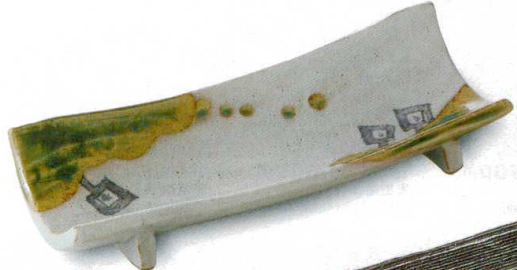
17007-186 5,250円 251812203 織部筒割付出血 (230×75×45mm)