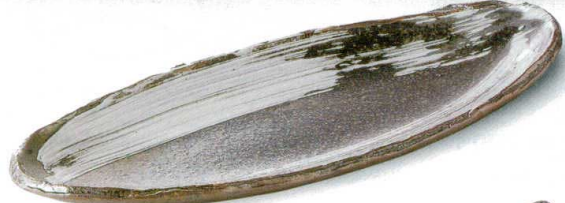
17003-436 4,000円 254312205 刷毛目付出血 (285×120×25mm)