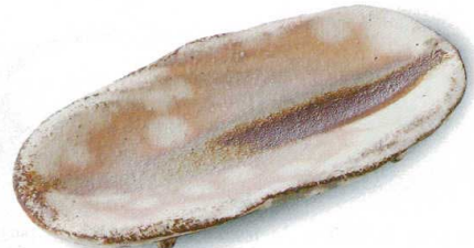
17001-436 4,800円 254312204 粉引小判足付変形皿 (210×125×30mm)