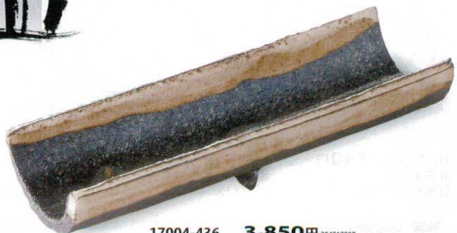
17004-436 3,850円 254312207 黒窯変掛分け6.7足付長皿 (200×65×38mm)