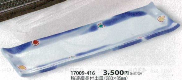
17009-416 3,500円 264117009 釉遊細長付出皿 (280×85mm)