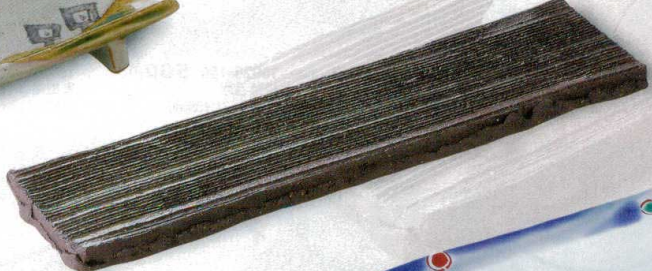
17008-086 5,500円 260917008 櫛目ビードロ長台皿 (345×85×23mm)