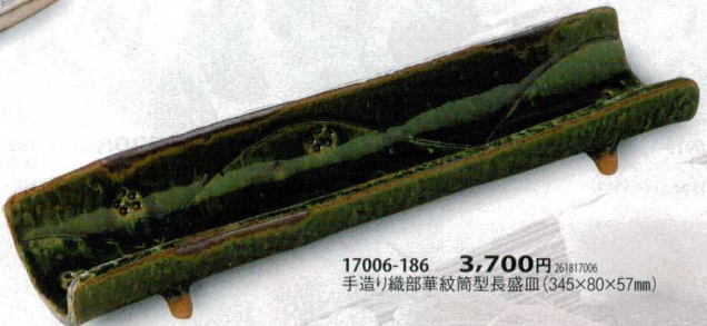
17006-186 3,700円 261817006 手造り織部華紋筒型長盛皿 (345×80×57mm)