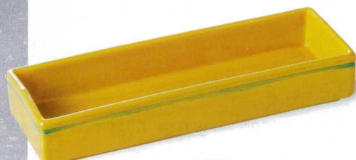
17002-306 4,400円 253012208 黄交趾長角8寸切立前菜皿 (239×80×40mm)