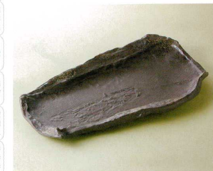
01811-226 8,940円 262201811 炭化土長角変形尺四寸皿(440×255×55mm)