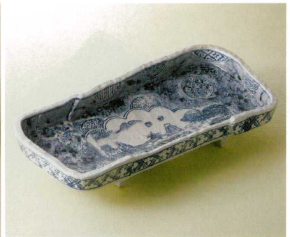
01810-136 9,800円 251322605 御深井山水切立長角大皿(380×190×75mm)