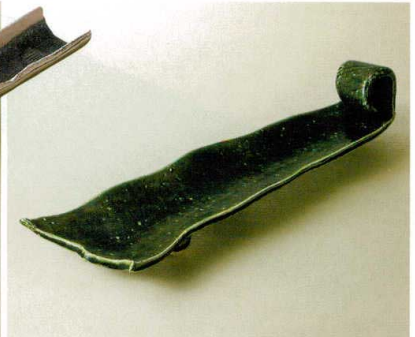
01804-086 11,000円 250813201 織部ひねり長皿(440×135×93mm)