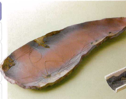
01801-076 19,000円 250722803 手造り焼ペオリベ2尺皿(600×255×60mm)