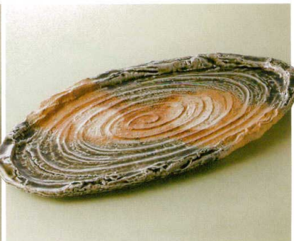
01818-476 7,200円 264701818 嵯峨野バーテャ皿(480×250×30mm)