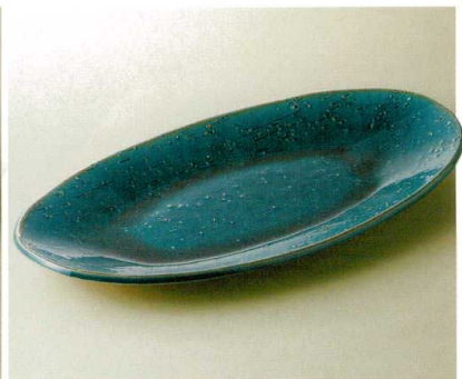
01814-436 8,500円 264301814 緑釉16.5楕円皿(475×250×45mm)