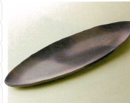
01805-436 2,860円 254322805 黒窯変変形皿(小)(305×110×30mm) 01806-436 7,700円 254322806 黒窯変変形皿(中)(500×140×35mm) 01807-436 11,000円 254322807 黒窯変変形皿(大)(635×195×40mm)