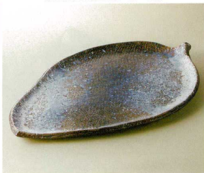
01812-436 6,400円 254322607 焼ペビードロ13.0葉形皿(410×240×35mm) 01813-436 8,800円 254322608 焼ペビードロ16.0葉形皿(485×290×40mm)