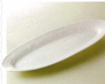
01815-026 4,850円 250222901 粉引長楕円皿(小)(430×175×35mm) 01816-026 8,130円 250222902 粉引長楕円皿(大)(600×210×46mm)