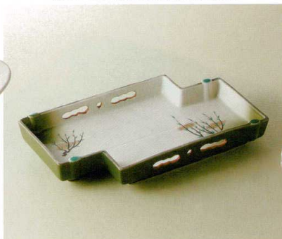
01817-186 7,500円 251822502 京橋10.0盛鉢(310×175×47mm)