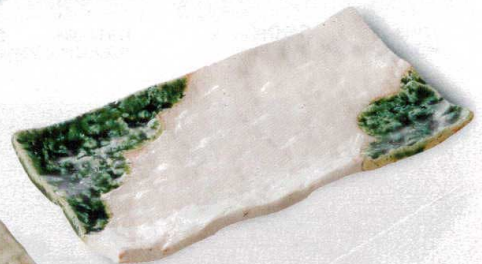
18011-406 4,300円 254013610 志野織部タタラ造長角皿 (225×128×25mm)