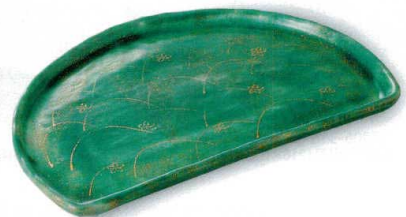
18003-186 5,600円 251813602 金緑彩半月皿 (235×160×27mm)