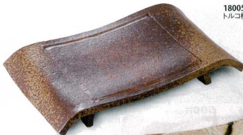
18008-186 2,400円 261818008 手造り備前風弓型7.0長角皿 (210×103×35mm) 18009-186 4,300円 261818009 手造り備前風弓型8.5前葉長角皿 (265×165×38mm)