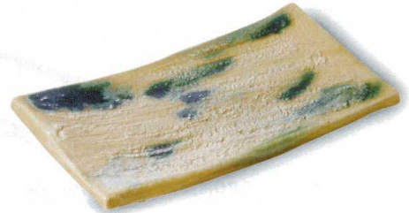
18001-416 7,200円 264118001 黄瀬戸手造り焼物皿(中) (240×125×30mm) 18002-416 8,500円 264118002 黄瀬戸手造り焼物皿(大) (255×155×30mm)