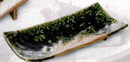
18012-406 4,100円 254012206 織部焼物皿 (250×120×28mm)