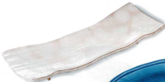
18004-216 5,500円 262118004 手造り粉引|タタキ長角盛皿 (342×120×42mm)