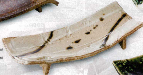
18010-036 4,200円 250313603 美濃伊賀まな板皿 (280×120×46mm)