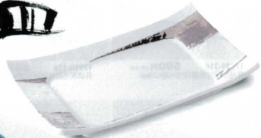
強 18006-216 3,400円 252113604 白磁プラチナ7.5寸長角四方皿 (220×135×30mm) 18007-216 4,900円 252113605 白磁プラチナ9.0寸長角四方皿 (272×167×37mm)