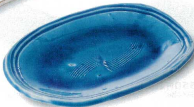
18005-286 4,520円 252822211 トルコ樹葉楕円皿 (213×167mm)