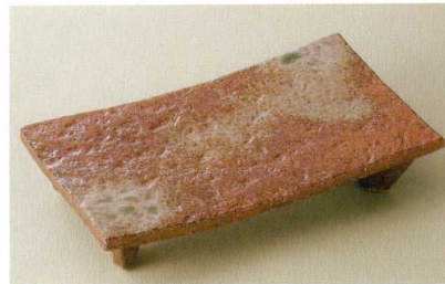
18112-356 3,300円 253513712 灰釉まな板皿 (215×135×40mm)