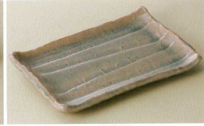
18111-316 3,360円 253113703 伊賀灰釉7.0長角皿 (217×156×25mm)