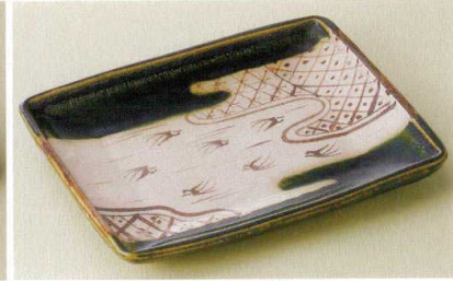
18108-456 3,400円 254513607 織部焼物皿 (手造り) (195×165×20mm)