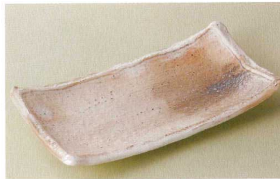
18109-436 3,400円 264318109 あけぼの7.3長角皿 (220×125×33mm)