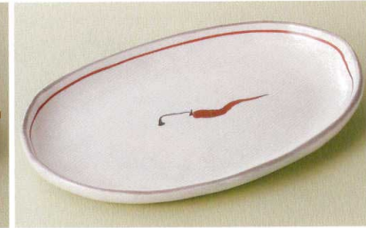
18113-456 3,300円 254513702 粉引赤絵唐辛子小判多用皿 (230×160×25mm)