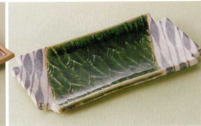
18116-406 3,200円 254012302 織部スミ切十草焼皿 (215×125×30mm)