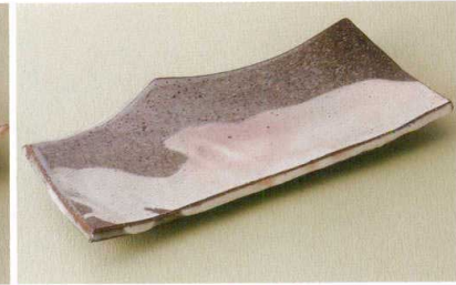
18110-036 3,400円 250313709 粉引変形焼物皿 (245×125mm)