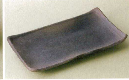
18114-436 3,300円 254513705 炭化8.0長方皿 (240×150×25mm)