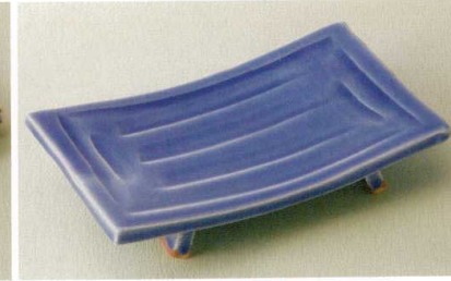
18117-186 3,200円 251813707 青釉ソギまな板焼物皿 (218×142×48mm)