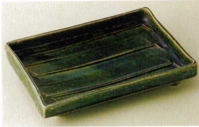
18101-126 3,900円 251213608 総織部切立7.0焼物皿 (210×160×40mm)