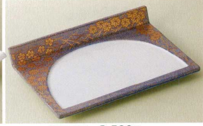
18103-186 3,500円 251813701 片上り雲錦焼物皿 (210×148×30mm)