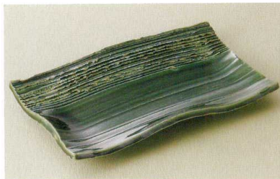
18104-186 3,450円 251813606 ヒタ織部焼物皿 (220×125×32mm)