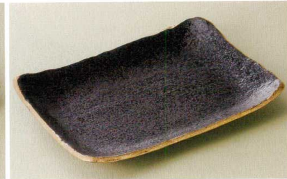
18105-456 1,900円 254513816 南蛮金彩7.0長角皿 (195×125×28mm) 18106-456 2,600円 254513817 南蛮金彩8.0長角皿 (235×145×30mm) 18107-456 3,200円 264518107 南蛮金彩9.0長角皿 (235×170×30mm)