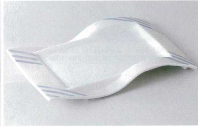
18311-186 2,700円 251821604 ブルー線ラスター前菜皿 (255×165×35mm)