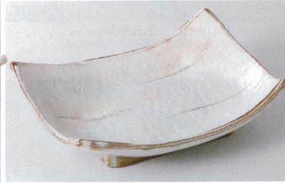
18314-156 2,600円 251513807 あげほの8.0長角皿 (195×150×60mm)