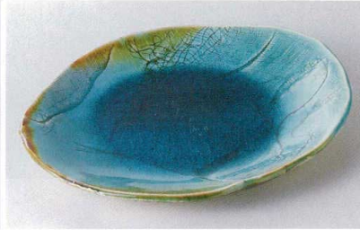
18303-406 2,700円 254015420 深海小判皿 (205×185×28mm)