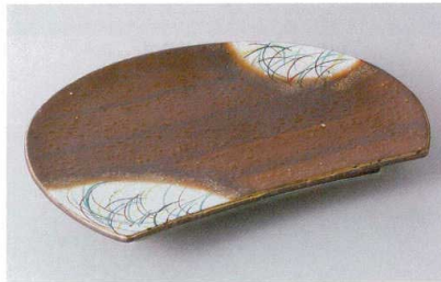
18312-086 2,500円 250815107 嵯峨野半月焼物皿 (215×152×28mm)