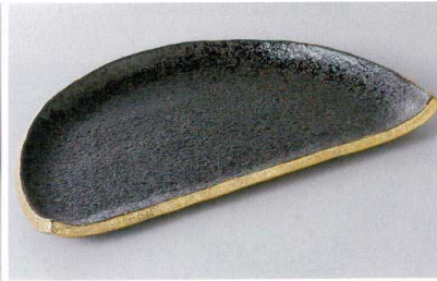
18317-456 1,900円 254515108 南蛮金彩7.0半月皿 (210×125×20mm) 18318-456 2,500円 254515109 南蛮金彩8.0半月皿 (245×145×20mm)