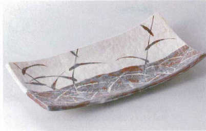
18302-456 2,700円 264518302 志野武蔵野焼物皿 (245×134×32mm)