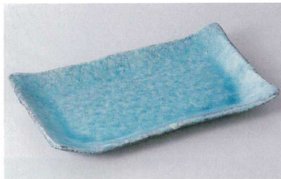
18304-036 2,800円 250313715 トルコからいざ長角皿 (230×150×30mm)