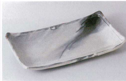
18316-436 2,500円 264318316 白化粧ぼかし8.0焼物皿 (240×150×25mm)