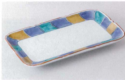
18315-236 2,500円 252313904 三色捺り模様焼物皿 (220×132×25mm)