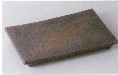
18310-226 2,660円 252213805 灰流四ツ足焼物皿 (216×153×22mm)