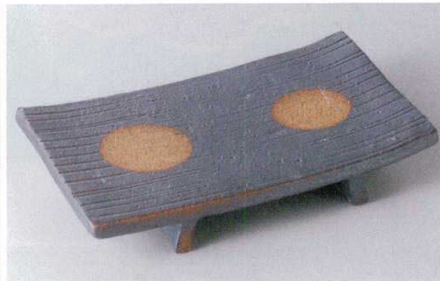
18305-336 2,700円 253313814 磁輪鉄丸紋焼物皿 (205×120×35mm)