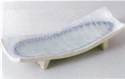
18313-236 2,550円 252313902 ブルー淡雪風大長まな板皿 (278×107×55mm)