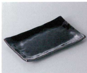
18718-316 1,150円 263118718 18719-316 1,350円 263118719 アメ天目5.5長角皿(170×118×26mm) アメ天目7.0長角皿(211×137×24mm)