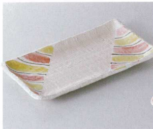
18709-326 1,430円 263218709 彩時空・風8.0長角皿(235×128×25mm)