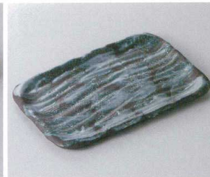
18716-156 990円 261518716 18717-156 1,380円 261518717 青雲海7.0板皿(190×120×15mm) 青雲海8.0板皿(210×145×13mm)