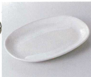
18713-156 760円 251515602 白ハケメ5.0小判皿(165×130×16mm)