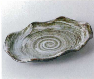
18702-176 1,450円 261718702 白刷毛8.0小判皿(245×170×32mm)