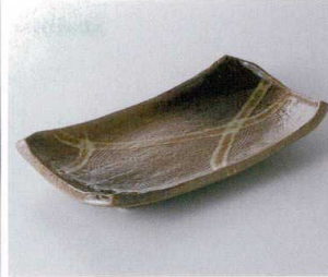
18703-186 1,450円 251814208 黒潮焼物皿(245×140×43mm)