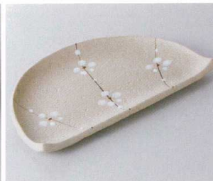
18715-326 1,380円 253215111 春一番半月7.0皿(210×125×21mm)