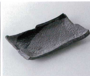
18721-026 1,350円 260218721 大和玄焼物皿(大)(220×136×33mm)