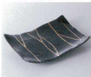
18723-086 1,450円 250814301 黒釉金線四ツ足焼物皿(217×165×35mm)