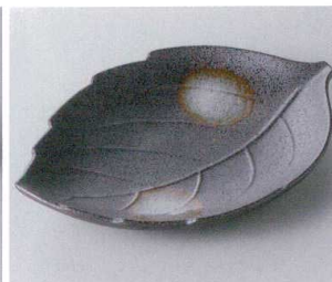
18725-206 1,300円 252014218 伊賀吹木の葉皿(236×168mm)