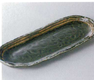
18712-326 1,400円 263218712 織部ライン小判長皿(292×126×22mm)