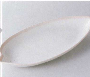
18710-286 1,430円 252815514 ピアビーンズ花びら長皿(305×150mm)