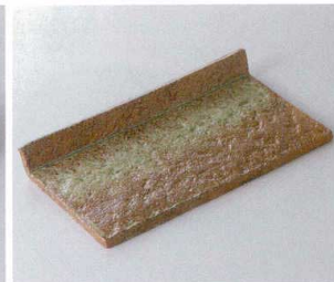
18722-356 1,350円 253514216 灰釉長角曲皿(225×115×50mm)