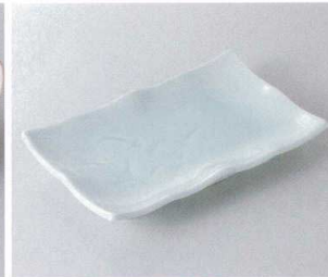
18711-266 1,400円 252614206 青白磁つゆ草焼物皿(215×140×30mm)