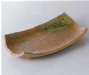
18701-306 1,450円 253014209 南蛮灰釉吹五足長角皿(240×140mm)