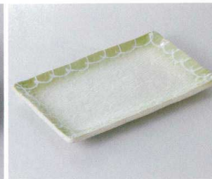
18726-416 1,300円 264118726 カゴメヒツ吹長角7.0皿(210×135×15mm)