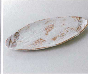
18704-316 610円 263118704 志野タタキ葉型皿(小)(172×112×18mm) 18705-316 1,450円 263118705 志野タタキ葉型皿(大)(280×143×22mm)