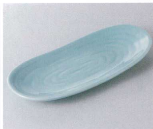
18720-126 1,350円 251214201 青磁小判型8.5あゆ皿(255×120×12mm)