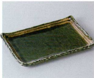
18821-326 970円 263218821 織部ライン6.0四足皿 (165×115×25mm) 18822-326 1,150円 263218822 織部ライン7.0長角皿 (204×140×22mm)