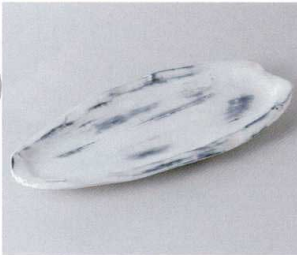
18808-336 1,250円 253314220 刷毛目焼物皿 (282×130×20mm)