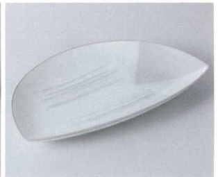
18825-256 460円 25351914 粉引(小)目半月小皿 (127×80×20mm) 18826-256 720円 25351915 粉引(小)目半月鉢々皿 (180×115×23mm) 18827-256 1,100円 25351916 粉引(小)目半月多用皿 (250×158×26mm)