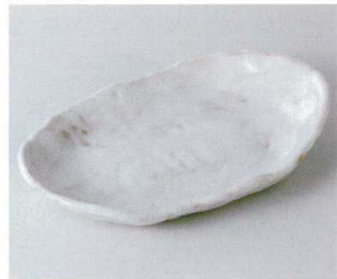
18810-316 1,280円 263118810 手造り風志野楕円多用皿 (248×164×40mm)