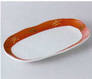
18818-026 1,150円 260218818 赤帯焼物皿 (223×128×25mm)