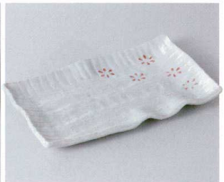
18819-326 740円 253214305 粉引小紋6.5長角皿 (170×130×25mm) 18820-326 1,150円 253214306 粉引小紋8.0長角皿 (225×140×24mm)