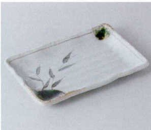
18824-476 1,100円 264718824 織部アッシュ7.0長角皿 (200×140×23mm)