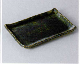
18805-416 1,320円 254114219 オリベ彫長角焼物皿 (210×145×15mm)