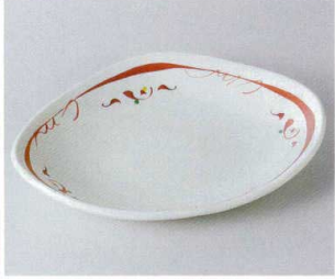
18802-216 900円 252115613 花くずし変形皿 (小) (147×125×28mm) 18803-216 1,350円 252115614 花くずし変形皿 (大) (203×170×30mm)