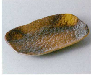
18801-086 1,300円 250814203 美膳岩焼物皿 (215×145mm)