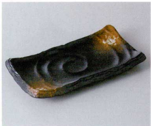
18817-476 1,150円 264718817 備前焼物皿 (小) (220×120×25mm)