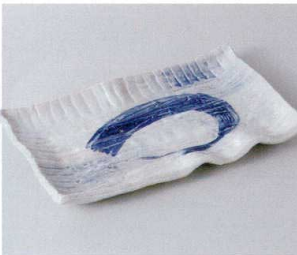
18812-326 1,200円 253214303 うず潮8.0長角皿 (225×140×25mm)