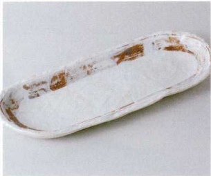
18807-326 1,280円 253215601 綿ぼうし小判長皿 (299×135×25mm)