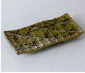
18804-136 1,330円 251314207 灰軸格子焼物皿 (225×120×20mm)