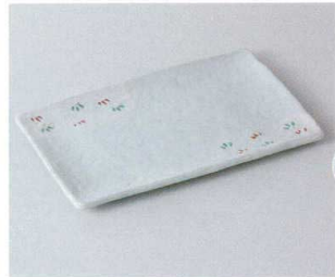
18806-416 1,320円 254114212 雪化粧7.0焼物皿 (205×130×12mm)