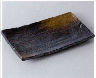
18809-216 1,250円 262118809 黒備前吹き23cm焼物皿 (225×145×30mm)