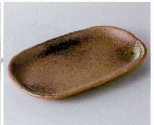
18813-236 780円 252315608 伊賀織部小判6.5皿 (197×125×22mm) 18814-236 1,200円 252315609 伊賀織部小判8.0皿 (243×158×22mm)