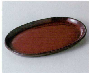
18815-316 840円 253115518 ぬくもり小判6.0皿 (177×123×21mm) 18816-316 1,200円 253115519 ぬくもり小判7.0皿 (226×150×17mm)