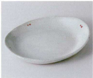
18811-406 1,200円 264018811 辰砂楕円皿 (205×170×30mm)