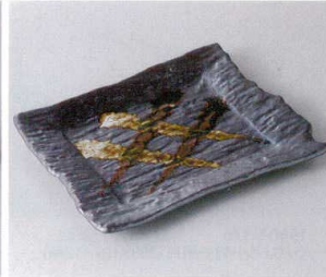
18903-306 1,050円 253020063 錆流し焼物皿 (206×163×20mm)