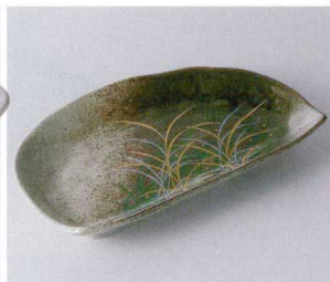
18906-166 700円 251615701 金彩武蔵野半月5.0皿 (167×124×25mm)