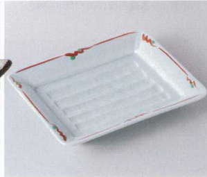
18924-186 1,000円 251814405 青地赤絵角向付 (175×145mm)