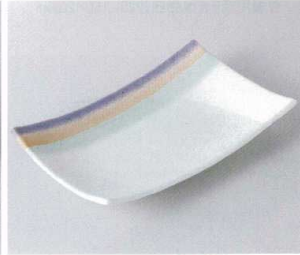
18925-416 1,000円 264118925 虹四ッ足焼物皿 (200×132mm)