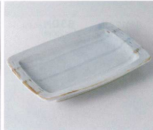
18918-156 600円 25154014 コス巻角6.0皿 (190×129×25mm)