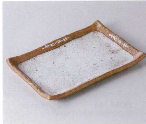
18901-156 1,100円 251514211 うのふ茶唐津7.0長角皿 (208×146×22mm)