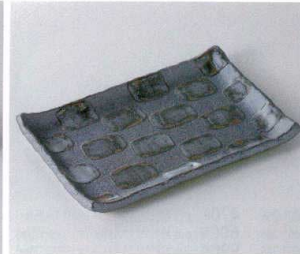
18904-316 1,050円 263118904 黒斑点7.0長角皿 (207×145×22mm)