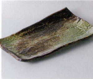
18923-476 1,000円 264718923 灰袖吹変形焼物皿 (270×150×30mm)