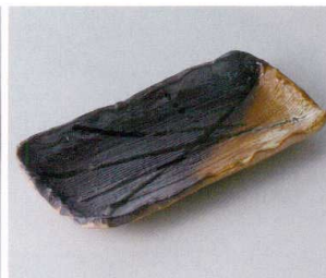
18908-076 1,050円 250714304 焼が長角皿 (212×114×28mm)