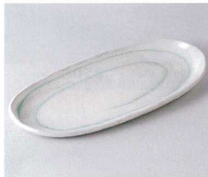
18910-156 1,050円 261518910 粉引緑線楕円焼物皿 (259×130×22mm)