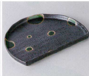
18912-326 1,050円 263218912 織部丸紋半月皿 (200×146×16mm)