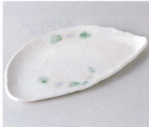
18916-156 1,000円 261518916 椿半月皿 (246×149×20mm)