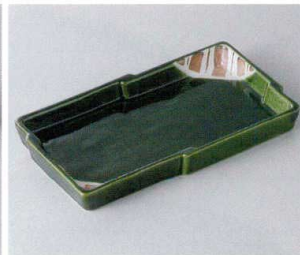
18913-266 550円 252614307 青海波切立長角皿(中) (140×112×25mm)