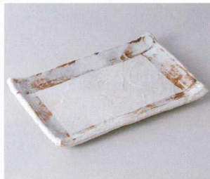
18911-326 1,050円 263218911 綿ぼうし7.0長角皿 (204×145×25mm)