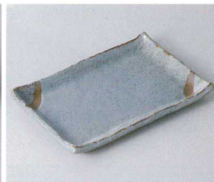
18909-316 1,050円 253114302 水辺焼物皿 (205×145×25mm)