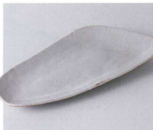
18905-226 1,060円 252214313 雪志野唐津三角トレイ(大) (304×145×25mm)