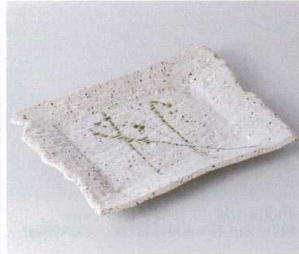
18902-206 1,080円 252014318 グリーン吹焼鳥皿 (205×160mm)