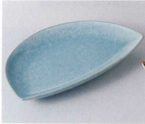
18921-036 650円 250315117 ブルーカイラギ半月銘々皿 (180×115×22mm)