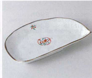
18917-166 1,000円 251615624 赤絵花半月焼物皿 (225×139×30mm)