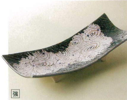
01901-306 6,900円 253022813 織部錆渦大皿 (400×160×75mm)