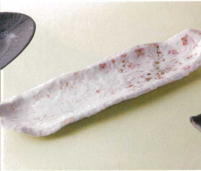
01905-026 6,410円 250222814 志野桜長盛皿 (505×140×51mm)