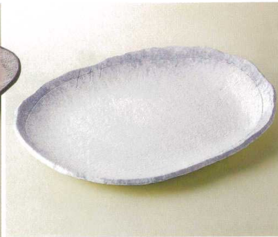
01908-056 6,000円 250520306 青彩大盛皿 (400×310×45mm)