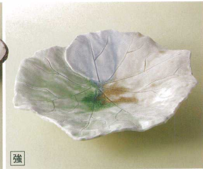
01912-036 5,600円 260301912 三色ビードロ芙蓉葉大皿 (360×310×64mm)