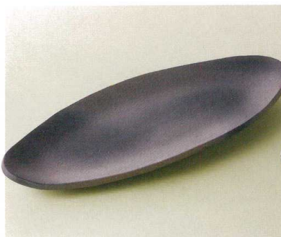
01910-436 5,720円 254315403 黒窯変変形足付長皿 (400×175×50mm)