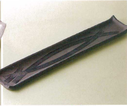
01906-136 6,400円 251322811 炭火土尺八長皿 (535×100mm)