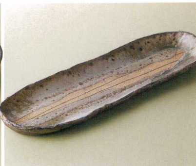
01911-086 5,600円 260801911 美濃伊賀釉丸長皿 (420×140mm)