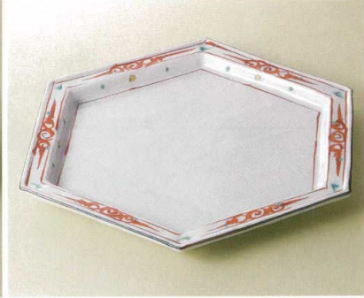
01903-306 6,500円 253019607 六角赤絵渦唐草盛皿 (379×330×24mm)