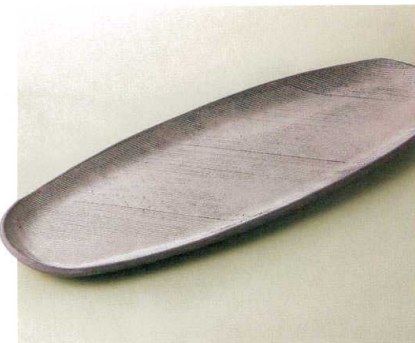
01907-456 6,500円 254522812 黒陶クシ目楕円大皿 (530×185×30mm)