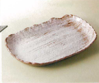
01902-236 6,900円 252321701 粉引/ハケ巻12.0お好み皿 (372×268×42mm)