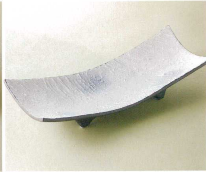
01909-036 6,000円 250321402 ラスター長角大皿 (410×160×75mm)