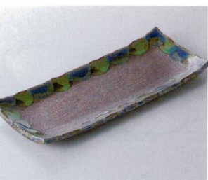
20008-326 1,300円 253213407 きらめきサンマ皿 (292×125×27mm)