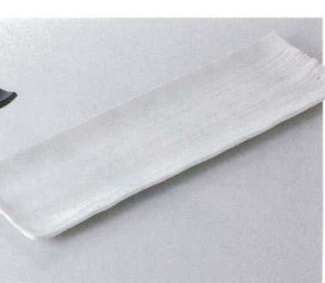
20020-026 1,130円 260220020 刷毛目サンマ皿 (大) (345×110×16mm)