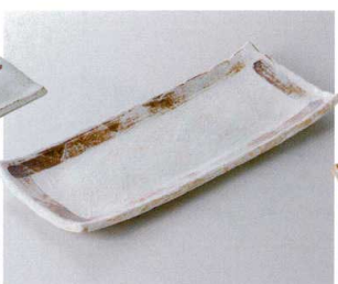
20010-326 1,280円 263220010 綿ぼうれサンマ皿 (290×123×25mm)