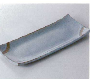
20012-316 1,260円 253113404 水辺さんま皿 (288×124×28mm)