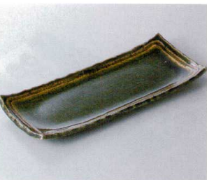
20004-326 1,400円 263220004 織部ラインさんま皿 (285×120×25mm)