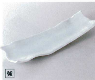
強 20005-136 1,400円 261320005 青白磁ちぎり11.0長皿 (322×110×45mm)