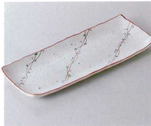
20001-026 1,420円 260220001 赤絵新芽長角皿 (274×112×21mm)