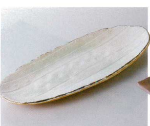
20018-036 1,150円 260320018 せせらぎ楕円長皿 (333×138×29mm)