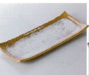
20011-156 1,280円 251513405 うのふ茶唐津さんま皿 (290×125×27mm)