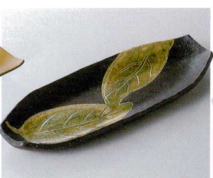
20014-276 1,180円 262720014 織部巴葉多用皿 (305×123mm)