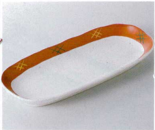
20002-026 1,400円 260220002 赤帯サンマ皿 (283×130×30mm)