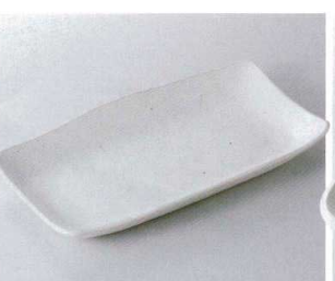
20015-476 1,180円 264720015 万里の河ほっけ皿 (300×170×35mm)