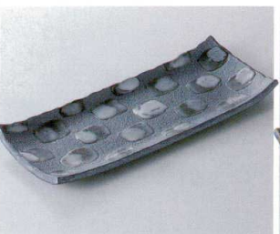
20007-316 1,370円 263120007 黒斑点サンマ皿 (286×123×27mm)