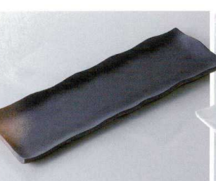
20019-276 1,150円 262720019 黒南蛮波瀾長皿 (340×115×18mm)