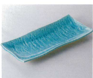
20017-326 1,080円 253213504 青々さんま皿 (282×130×30mm)