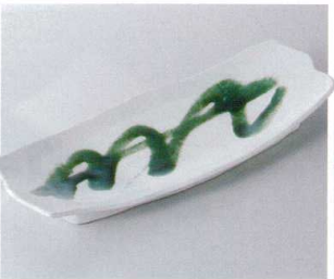
20003-136 1,400円 251313403 オリベ流し焼物皿 (305×125×32mm)