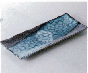
20006-066 1,380円 260620006 清流さんま皿 (288×120×23mm)