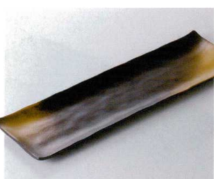
20013-206 1,250円 262020013 黄金吹11.5サンマ皿 (オリジナル) (344×110×20mm)