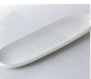
20016-226 1,280円 253213410 粉引おたのしみ皿 (345×108×22mm)