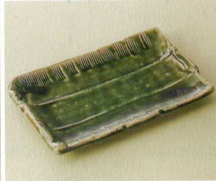
20302-406 2,350円 254017003 織部くし目長角皿(155×102×15mm)