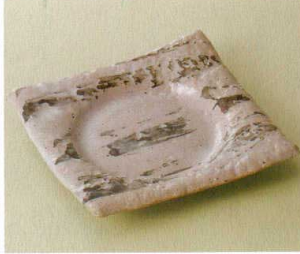
20303-406 2,000円 254017004 灰袖口変り皿(145×145×25mm)