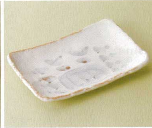
20312-416 1,100円 264120312 志野カニ長角6.0皿(160×112mm)