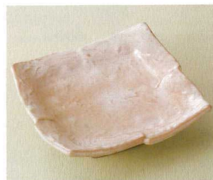
20313-456 1,050円 254517020 粉引足付銘々皿(125×125×35mm)