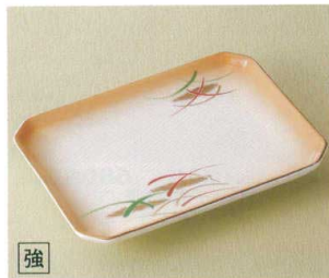
20305-086 2,000円 260820305 加茂川焼鳥皿(160×122×24mm)