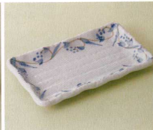
20319-476 850円 264720319 唐草6.0長角皿(175×100×20mm)