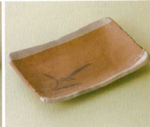
20320-156 840円 251517101 剃唐津掛戸長角5.0皿(156×110×18mm)