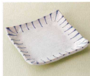
20317-316 940円 263120317 呉須十草正角銘々皿(135×135×22mm)