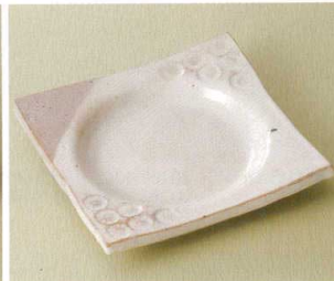
20306-406 1,500円 254017012 粉引印花角銘々皿(125×125×20mm)