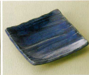
20316-456 960円 254517021 藍彩華波彫銘々皿(120×120×20mm)