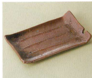
20309-406 1,200円 264020309 灰袖焼鳥皿(1454×97×18mm)