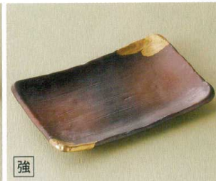
20310-456 1,180円 254517018 焼締金雲5.5長角皿(160×110×20mm)