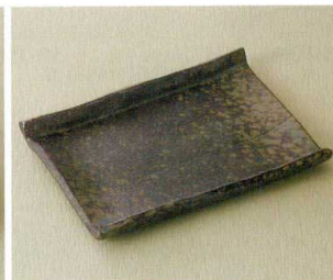
20314-056 1,000円 250517026 備前風手造り取皿(130×85×15mm)