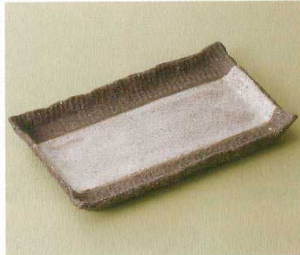
20307-026 1,450円 260220307 黒土粉引縄紋角銘々皿(180×114×20mm)