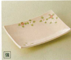
20311-156 1,150円 261520311 ページュ小花5.0取皿(162×114×27mm)