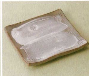
20315-416 960円 254117024 粉引印花紋正角銘々皿(120×10mm)