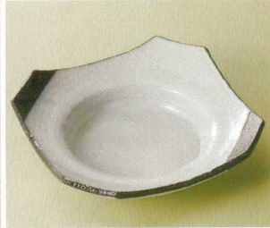
20308-216 1,260円 252117519 黒土粉引掛け角丸皿(小)(150×150×35mm)