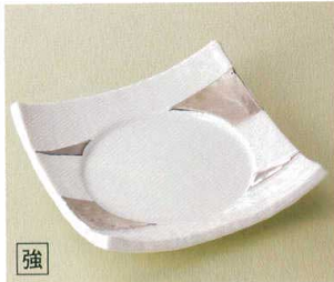
20301-216 2,550円 252117406 白磁プラチナ5.0寸四方皿(142×142×33mm)