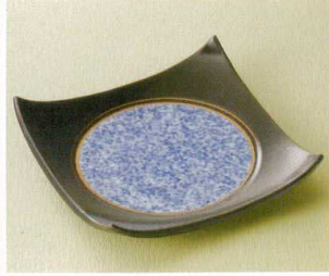
20304-056 2,000円 250517419 吹墨角皿(145×145mm)