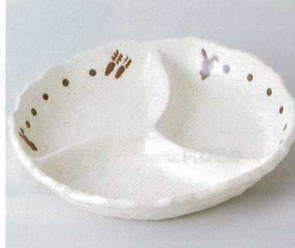
20607-356 1,500円 263520607 おこのみおかず皿 (215×205×35mm)