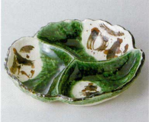
20605-306 1,850円 253015209 織部三ツ仕切7.0鉢 (210×210×40mm)