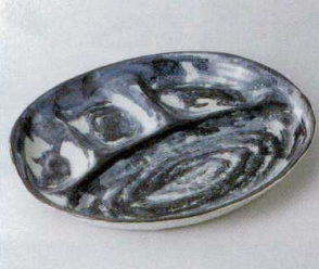
20606-186 1,750円 251815208 藍染ランチ皿 (300×265×30mm)