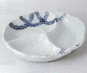
20602-306 3,250円 253015204 かいらぎ三切9.0鉢 (270×250×50mm)