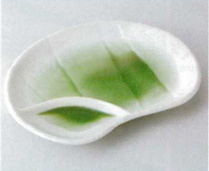
20609-306 1,500円 253015214 うのふエメラルドそら豆ランチ皿 (235×190×27mm)