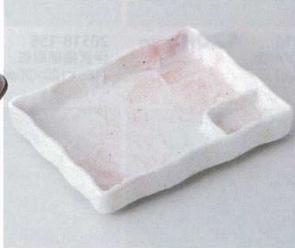
20615-176 1,100円 261720615 桜志野長角仕切皿 (180×143×28mm)