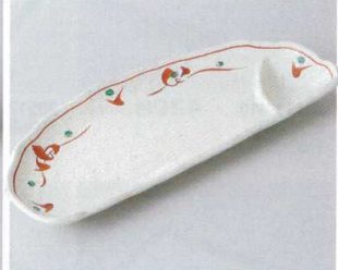
20612-176 1,250円 261720612 粉引赤絵半月仕切皿 (277×120×29mm)