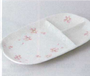
20603-476 2,000円 264720603 桜の舞ランチプレート(赤) (285×165×25mm)