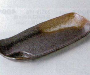
20614-276 1,150円 252715217 チョコ白吹スバ皿 (335×150×40mm)