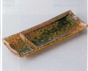
20621-176 990円 261720621 伊賀の里竹割り仕切皿(大) (248×95×27mm)