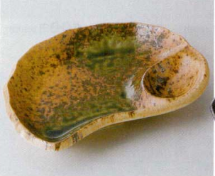
20613-066 1,240円 250615213 伊賀織部貝形仕切皿 (220×170×40mm)