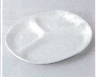
20616-186 1,000円 261820616 白袖三ツ切10吋仕切皿 (248×213×22mm)