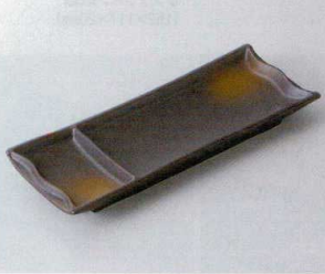
20618-076 700円 260720618 備前竹割刺身皿(小) (213×93×27mm) 20619-076 950円 260720619 備前竹割刺身皿(大) (250×93×30mm)