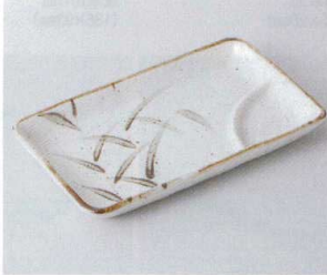
20620-416 960円 254115301 紅志野アシ7.0長角仕切皿 (203×125×20mm)