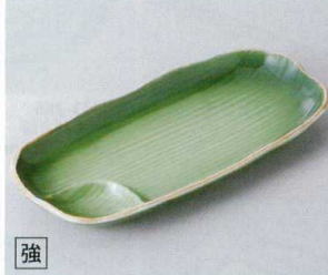
20611-316 1,290円 253115211 緑彩松花堂長皿(仕切付) (230×113×25mm)