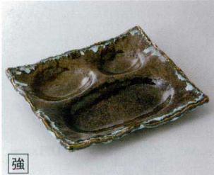
20601-166 6,000円 251615202 桃山天目三品盛皿 (275×250×40mm)