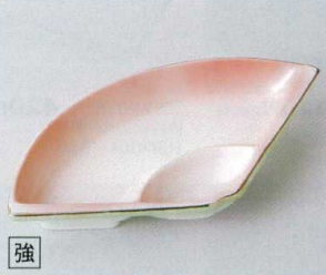
20610-326 1,450円 263220610 二色吹扇面刺身鉢 (187×105×26mm)