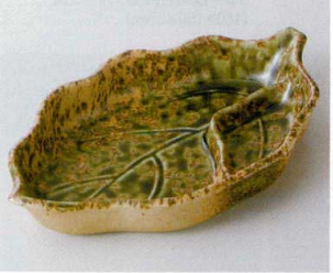
20617-176 970円 261720617 伊賀の里葉型仕切皿 (216×133×32mm)