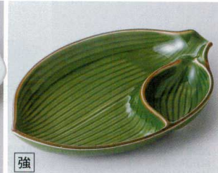
20604-156 1,900円 261520604 緑袖笹形仕切付焼物皿 (235×163×40mm)