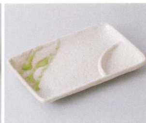
20721-026 460円 250215320 ビード口流し6.0仕切皿 (175×119×22mm)