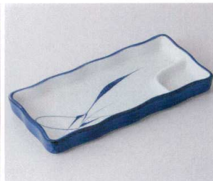
20706-266 770円 252015302 コス巻笹長角仕切皿 (230×112×25mm)