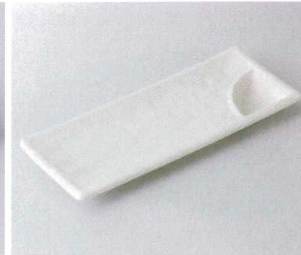
20714-106 650円 251015315 白斑点仕切付長角さんま皿 (283×118×27mm)