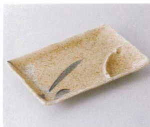
20720-416 640円 254115319 斑点アシ仕切8.0皿 (210×145×25mm)