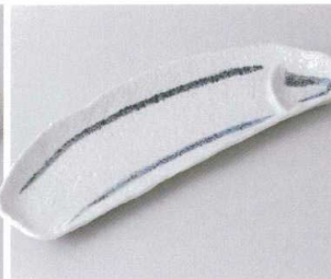
20707-156 760円 251515305 オフケライン 半月仕切付多用皿 (315×120×24mm)