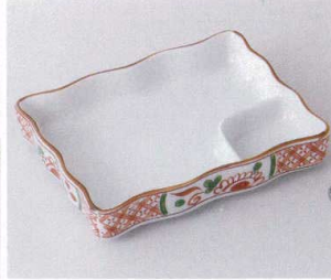
20702-176 800円 261720702 赤絵祥瑞波型仕切皿 (156×120×30mm)