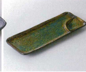
20704-156 790円 261520704 潤茶緑彩仕切付さんま皿 (303×121×23mm)