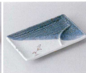
20722-156 400円 251515321 半掛芦6.0仕切皿 (171×112×20mm)