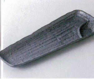
20703-106 850円 261020703 黒斑点末広型仕切付さんま皿 (353×138×H30mm)