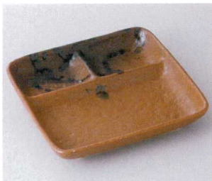
20705-156 790円 261520705 伊賀織部仕切付正角皿 (172×165×30mm)