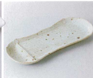
20708-416 780円 254115314 斑点五平型仕切皿 (293×120×25mm)