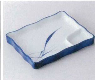
20712-266 540円 252615310 コス巻笹仕切皿 (中) (148×115×25mm)