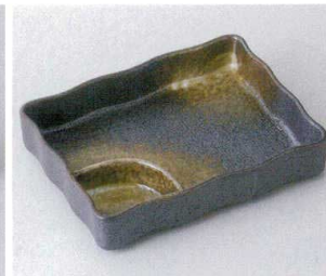
20718-256 600円 252515317 黒伊賀仕切皿 (145×115×30mm)