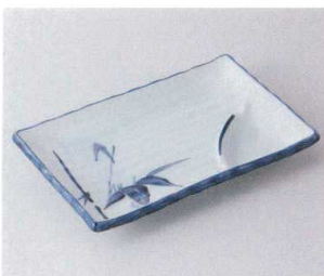
20719-416 650円 254115318 笹仕切皿 (210×140mm)