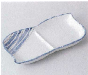
20715-326 630円 263220715 清流まめ型仕切皿 (枝豆) (230×125×21mm)