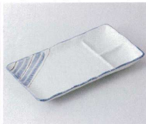
20716-326 630円 263220716 清流8.0長角串皿 (小) (220×120×22mm)