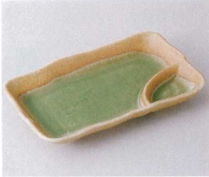
20701-256 840円 252515312 伊賀仕切皿 (215×130×30mm)