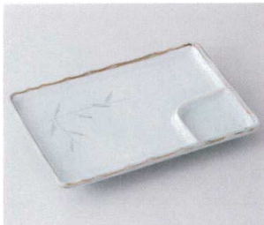
20709-176 700円 261720709 グレー芦7.0仕切皿 (182×130×22mm)