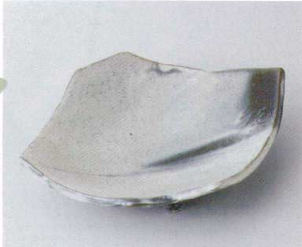
20804-436 3,100円 264320804 白化粧ぼかし三ツ足変型角皿 (165×160×50mm)