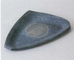
20809-436 2,200円 264320809 黒窯変ポタモチ7.0変形皿 (210×140×27mm)