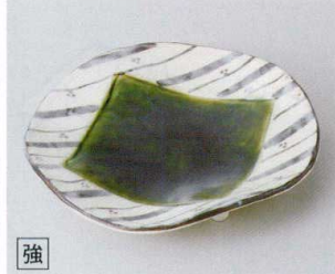
20807-306 2,400円 253018206 四足変形筋皿 (180×180×34mm)