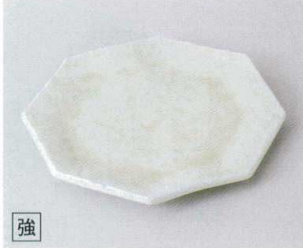
20813-166 2,000円 251618212 高麗八角向付 (176×176×18mm)