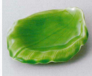
20815-286 1,900円 263820815 若草色芭蕉皿 (大) (250×170×20mm)