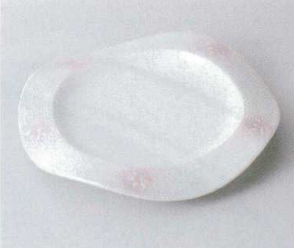
20806-186 2,400円 251818204 ピンクボカシラスター和皿 (195×25mm)