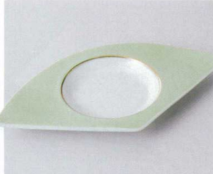
20803-126 3,200円 251212305 ヒワ弓型前菜皿 (252×168×34mm)