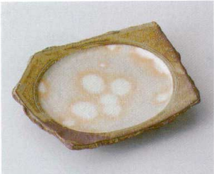
20801-436 5,720円 25432201 粉引五角変形皿 (175×155×35mm)