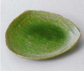
20814-436 1,980円 254317417 緑彩三角皿 (170×170×30mm)