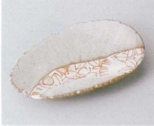
20817-226 1,760円 263220817 京春秋楕円皿 (177×127×22mm)