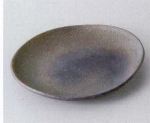
20811-436 2,150円 254317409 黒窯変精円皿 (185×165×35mm)