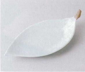
20818-216 1,750円 252117423 白磁木ノ葉皿 (233×125×39mm)