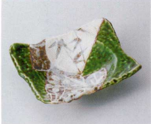
20812-226 2,070円 263220812 織部草花長皿 (160×140×45mm)