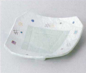
20810-186 2,200円 261820810 ジュエリー変形6.5皿 (202×165×42mm)