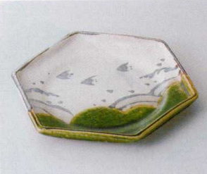
20802-406 4,200円 254022214 織部波千鳥六角皿 (205×190×25mm)