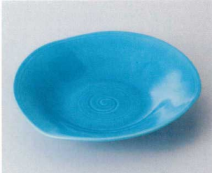
20805-306 2,800円 253017404 トルコ皿 (168×165×28mm)