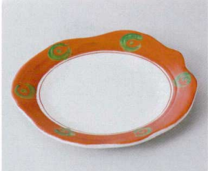
20808-186 2,250円 251818205 手造り粉引朱巻和皿 (200×22mm)