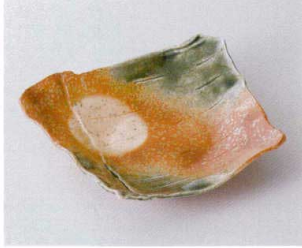
20821-476 1,750円 264720821 嵯峨野変形前菜皿 (175×160×50mm)