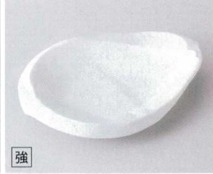
20819-086 1,000円 260820819 強化白釉ちぎり4.5寸皿 (138×115×34mm)