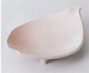
20816-406 1,850円 254022406 桜取皿 (207×155×45mm)