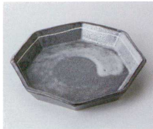
21010-156 760円 251518316 ネズミ志野八角5.0皿 (166×23mm)