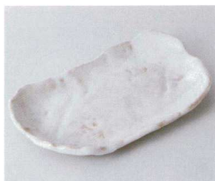
21015-316 690円 263121015 手造り風志野変形焼物皿 (183×116×22mm)