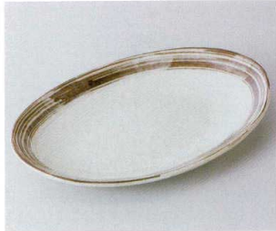
21001-326 860円 253217621 くりちよこフルーツ皿 (204×140×21mm)