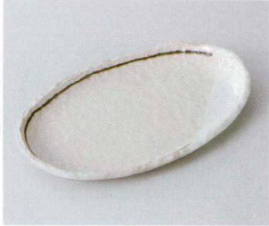
21005-416 840円 254171707 カイルキサビライン小判銘々皿 (180×120mm)