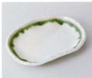
21006-156 840円 251517110 半掛織部流小判銘々皿 (160×128×18mm)