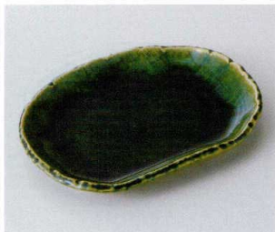
21008-086 830円 250817118 織部小判皿(小) (158×125mm)