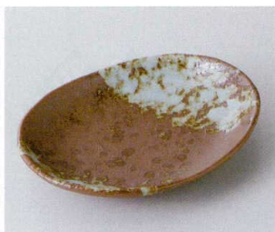
21017-076 670円 250317805 伊賀流水5.5楕円皿 (162×126×28mm)