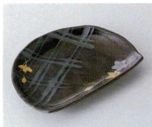
21019-166 670円 251617128 春秋半月5.0皿 (165×123×25mm)