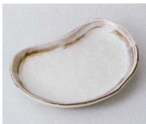
21016-326 680円 253217801 くりちよこそら豆皿 (165×130×20mm)