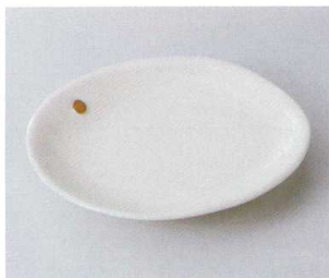
21020-026 630円 250217806 たゆたゆ取皿 (169×154×25mm)