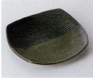
21002-086 850円 250817719 2way亀甲小皿(黒) (144×140×20mm)