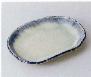
21007-086 830円 250817114 オフケ小判皿(小) (158×125mm)