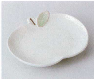
21011-076 760円 250717722 クリームマットアップルソーサー (138×120×25mm)