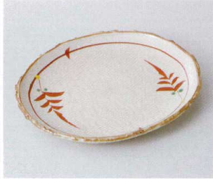
21003-156 650円 251517104 灰袖赤絵銘々皿 (138×128×15mm) 21004-156 840円 251517105 灰袖赤絵取皿 (168×150×18mm)