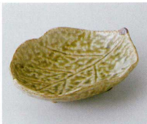
21022-076 630円 260721022 天龍流し葉型浅鉢 (135×102×41mm)