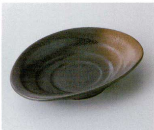
21009-206 800円 262021009 備前吹き波紋鉢 (195×143×30mm)