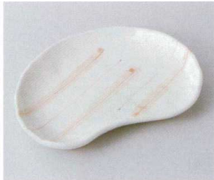
21012-326 750円 253217716 かりんそら豆皿 (166×140×17mm)