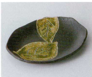
21018-276 670円 262721018 織部巴葉取皿 (158×125mm)