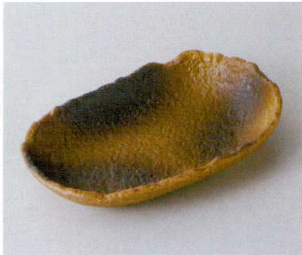
21013-186 700円 251817724 信楽吹5.0楕円深皿 (156×120×33mm) 21014-186 1,000円 261821014 信楽吹6.0楕円深皿 (200×136×34mm)