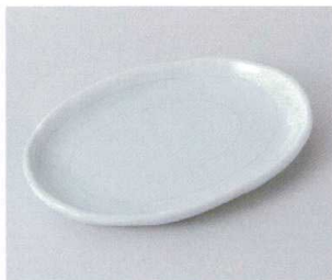
21021-316 630円 253117809 やよい楕円取皿 (165×120×15mm)