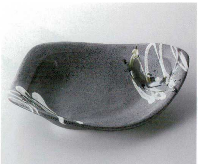
02207-116 5,800円 261102207 黒釉乱線変形尺皿軽量(310×257×65mm)