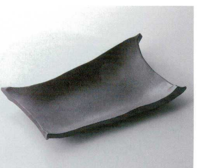
02213-476 4,600円 254722505 炭化土ちぎり盛皿(225×350×45mm)