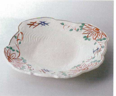
02203-186 8,800円 251822609 志野釉赤絵ナデ角尺1盛込皿(315×315×55mm)