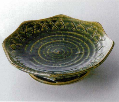
02202-416 9,000円 264102202 オリベ8.0高台鉢(240×65mm)