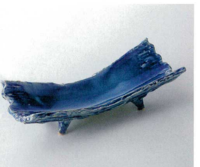
02209-436 5,000円 264302209 青ガラス10.3変形長角皿(310×110×75mm)