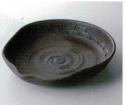
02206-086 6,000円 250822703 炭化瓢型尺盛鉢(324×310×70mm)