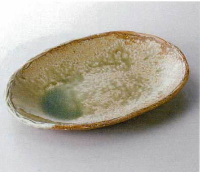
02205-436 6,300円 254315804 灰釉楕円盛皿(315×240×40mm)