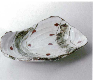
02208-136 5,000円 251322705 錆絵辰砂渦彫尺一盛込皿(350×270×65mm)