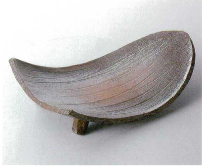
02201-186 11,000円 251822604 備前風枯木形足付盛込皿(345×220×57mm)