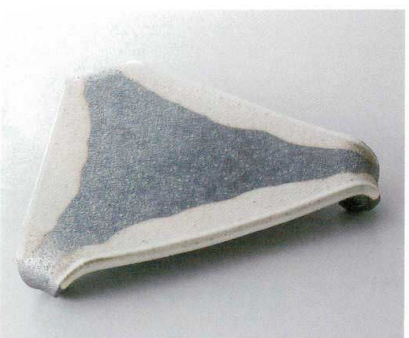
02210-436 4,950円 254322210 黒窯変掛け分け7.0三角高台皿(230×200×40mm)