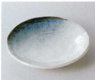
22414-476 380円 254718318 青錆流し手びねり5.0皿(165×27mm)