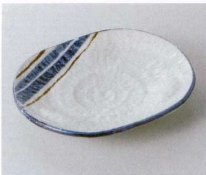
22410-326 450円 263222410 清流小判和皿(152×132×22mm)