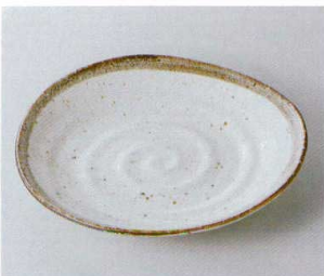
22419-476 330円 264722419 白唐津5.0皿(165×25mm)