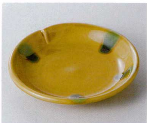
22412-126 380円 261222412 黄瀬戸3.5丸皿(120×25mm) 22413-126 460円 261222413 黄瀬戸4.5丸皿(150×25mm)