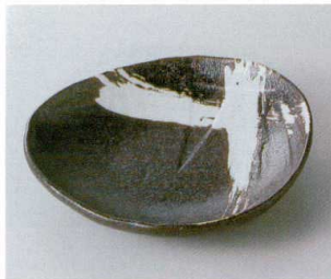
22405-206 550円 262022405 銀黒白刷毛5.0皿(155×150×30mm)