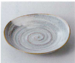
22417-476 330円 254717927 均窯粉引彩花5.0皿(164×30mm)