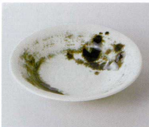
22411-166 440円 251617907 いこい5.0皿(161×32mm)