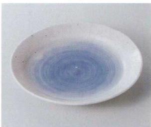
22421-076 240円 250717925 青刷毛目5.0皿(162×24mm)