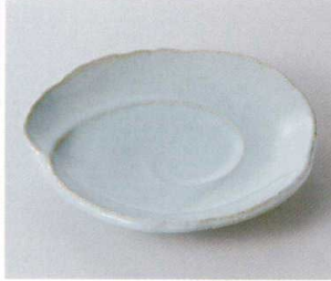
22403-026 650円 260222403 赤土青灰銘々皿(158×158×30mm)