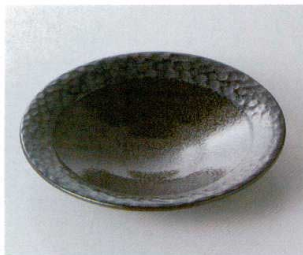
22409-056 470円 260522409 茶色ショコ5.0皿(155×25mm)