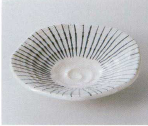
22402-216 650円 252117731 呉須十草5.0皿(157×155×36mm)