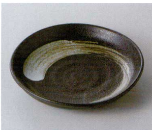
22420-276 340円 252717923 黒刷毛三ツ山5.0皿(170×31mm)