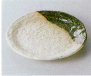
22401-256 670円 26252401 民楽桃山荒石目17cm丸皿(175×25mm)