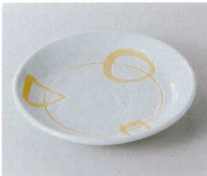
22406-286 550円 252817919 あそび5.0皿(165mm)