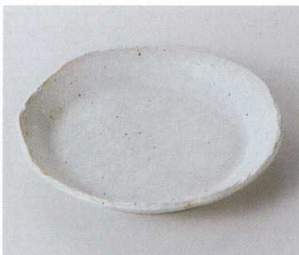
22416-226 350円 262222416 砂唐津5.0皿(150×26mm)