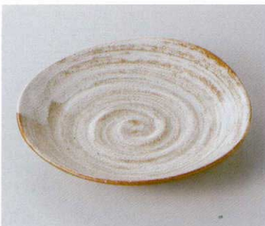
22415-026 360円 250217924 茶刷毛目5.0皿(165×28mm)