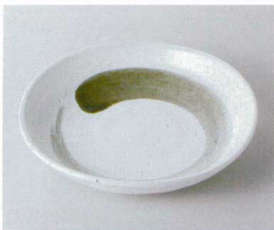
22418-276 340円 252717922 白刷毛三ツ山5.0皿(170×31mm)