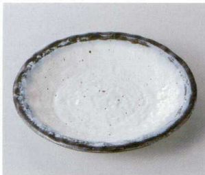
22407-176 530円 261722407 なごり雪石目5.0皿(163×25mm)