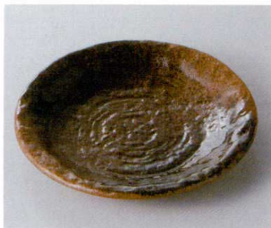
22408-236 480円 252318317 伊賀オリベ映石目5.0皿(163×25mm)