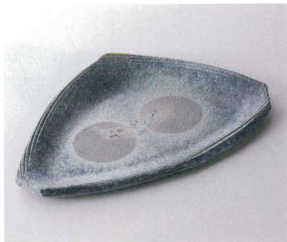
02304-436 3,500円 264302304 黒窯変ボタモチ8.5変形皿 (255×168×30mm) 02305-436 4,200円 264302305 黒窯変ボタモチ9.1変形皿 (275×185×30mm)