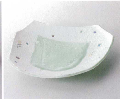
02313-186 3,500円 261802313 ジュエリー変形9.0皿 (278×235×50mm)