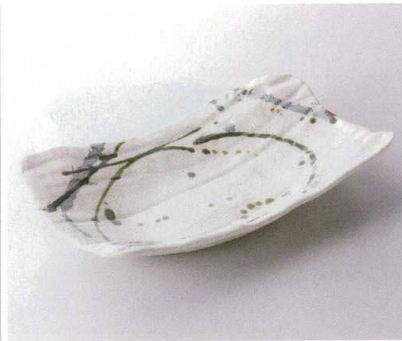
02306-086 4,200円 266802306 志野織部流盛鉢 (290×185×75mm)