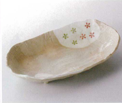
02302-326 4,300円 253222507 花ちらし小判盛鉢 (328×195×55mm)