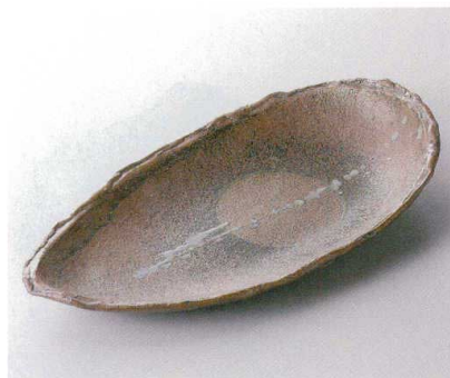
02311-436 3,620円 254322115 炭化ボタモチ10.0変形皿 (310×165×40mm)