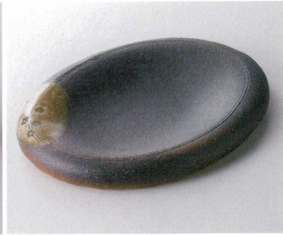
02307-436 4,200円 264302307 ビードロ小花7.8精円皿 (235×187×29mm)