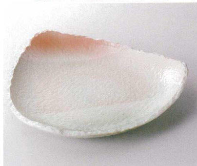
02308-326 3,800円 263202308 彩時空・虹三角盛皿 (特大) (271×266×45mm)