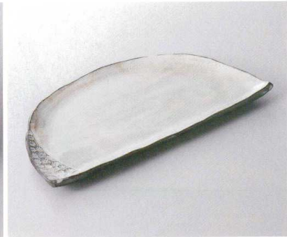
02310-406 3,700円 264002310 粉引印花半月皿 (275×158×17mm)