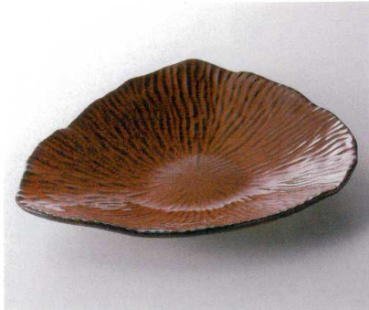
02301-126 4,400円 251222506 柿柚主税尺1皿 (340×280×55mm)