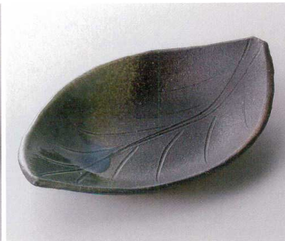
02309-436 3,800円 264302309 ビードロ7.0葉形皿 (265×165×50mm)