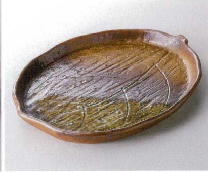
02303-336 4,200円 253322706 楽彩木ノ葉大皿 (350×280×30mm)