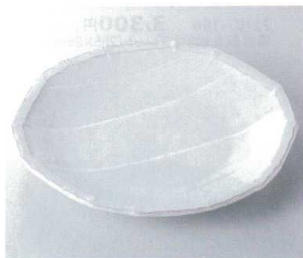
23206-476 250円 254719307 粉引|レンガ角銘々皿 (155×150×18mm)