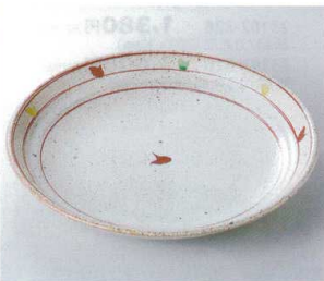
23209-086 1,250円 250819312 粉引千鳥8.0浅皿 (245×37mm)