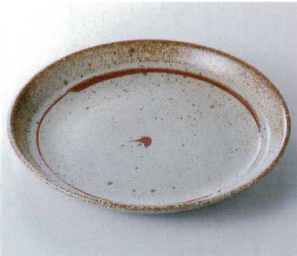
23203-086 1,500円 250819104 唐津一本線8.0皿 (248×37mm)