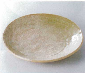
23219-236 850円 262232219 野あそび手びねり8.0皿 (245×35mm)