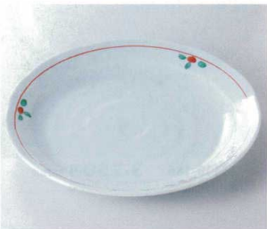
23221-076 500円 250718718 青磁赤絵花紋6.0皿 (190×26mm)