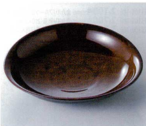
23208-276 1,400円 262723208 利休天目波潤8.0皿 (260×250×56mm)