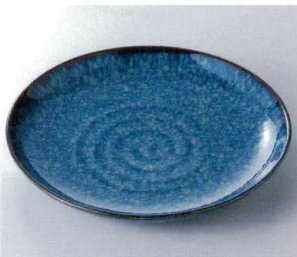
23215-176 1,080円 261723215 窯変ブルーウス型8.0皿 (257×34mm)