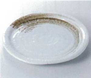
23202-216 1,580円 262123202 白茶刷毛8寸潤厚皿 (245×27mm)