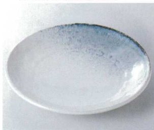
23223-476 800円 254719302 青錆流し手びねり8.0皿 (240×37mm)