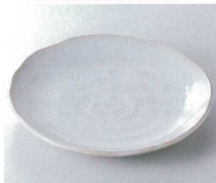
23211-076 760円 250718649 粉引|7.0皿 (214×31mm)