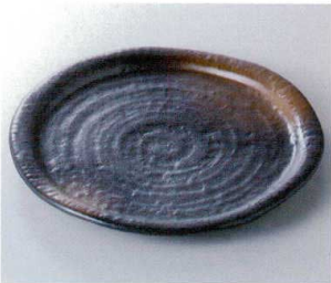
23204-056 850円 250518636 金茶吹6.0波皿 (205×17mm) 23205-056 1,500円 250518637 金茶吹8.0波皿 (245×25mm)