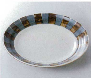
23226-166 790円 251619326 測十草8.0皿 (240×33mm)