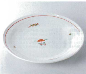
23213-076 800円 260723213 粉引|釉新赤絵なぶり7.0皿 (221×35mm)