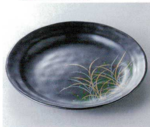
23217-166 470円 251618720 黒窯武蔵野5.0皿 (157×24mm)