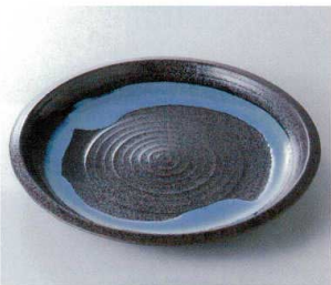
23216-086 900円 250819322 青均窯くぐりて8.0皿 (245×33mm)