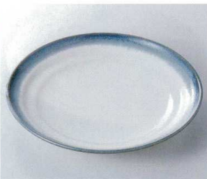
23225-166 790円 251619325 うのふ8.0皿 (240×33mm)