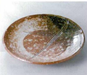
23220-206 800円 252019328 くし目灰吹8寸皿 (240×33mm)