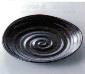
23210-176 1,240円 261723210 古瀬戸彩華9.0皿 (278×41mm)