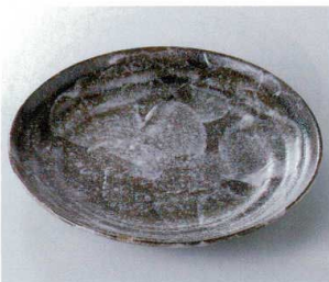
23224-166 790円 251619327 ネスミ8.0皿 (240×32mm)