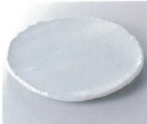
23201-286 1,600円 262823201 白河8.0丸皿 (250×25mm)