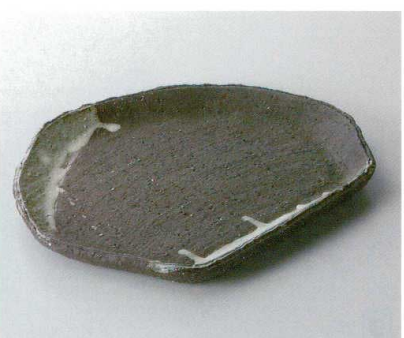
02412-436 3,080円 254322302 黒みかげ7.5掛け分け変形皿 (235×190×20mm)