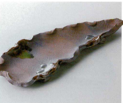
02407-216 3,400円 252122212 手造り変形波紋皿 (340×150×37mm)