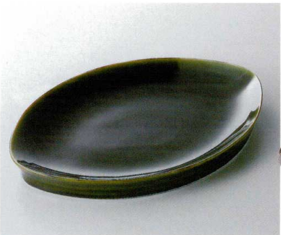
02405-126 1,900円 261202405 鉄織部楕円台皿 (246×175×30mm) 02406-126 3,400円 261202406 鉄織部楕円台皿(大) (295×212×31mm)