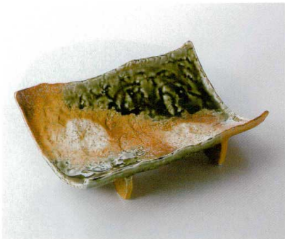
02404-476 3,500円 264702404 嵯峨野変形盛皿 (215×170×70mm)