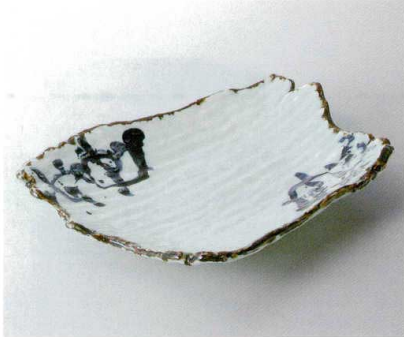
02401-256 3,500円 252522709 タコカラ草変型長角大皿 (340×270×60mm)