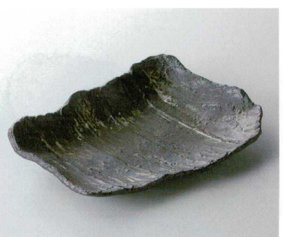
02413-076 3,700円 260722217 炭化土白化粧変形8.5皿 (257×193×56mm)