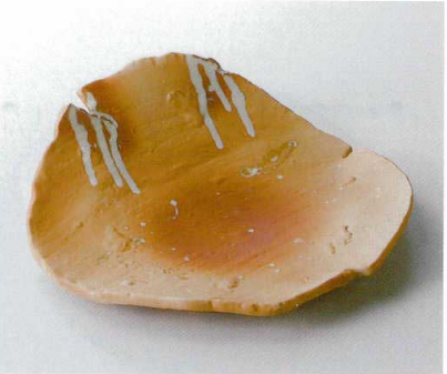
02403-086 3,400円 250822313 焼灰軸流し片上り8.5寸皿 (263×250×78mm)