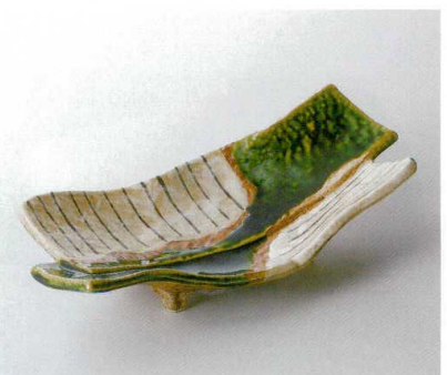
02410-136 3,100円 251322309 織部細十草尺寸盛皿 (300×150×70mm)