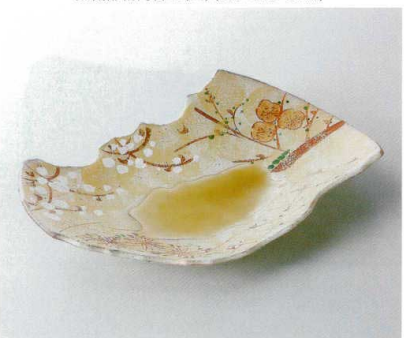
02409-226 3,300円 262202409 春秋ちぎり和皿 (296×190×53mm)