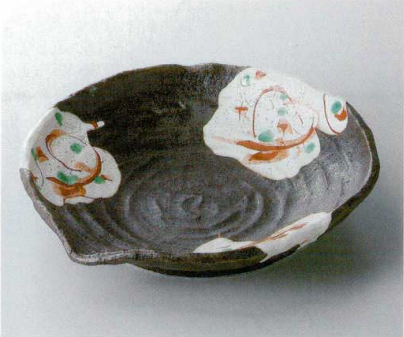
02402-186 3,450円 261802402 かいらぎ風赤絵片口8.5皿 (255×250×53mm)