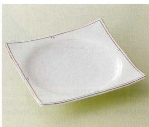
24015-036 2,500円 250320414 朱金ラスター正角5.5皿 (165×165×37mm)