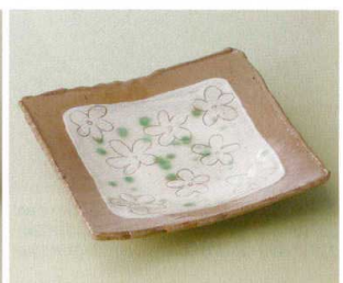
24017-216 2,300円 262124017 赤土花つくし角皿 (180×180×35mm)