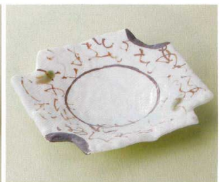
24021-086 2,150円 25082815 志野文字四切皿 (178×178×27mm)