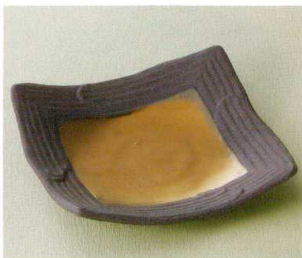
24019-086 2,300円 260824019 炭化土黄金ラスターのぎ正角5.5寸皿 (165×40mm)