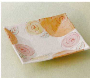
24020-136 2,250円 261324020 色彩薔薇波瀾5.5皿 (175×175×35mm)