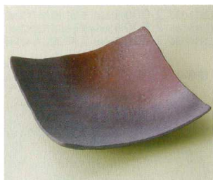
24005-436 3,150円 254320404 黒窯変角皿 (170×170×60mm)