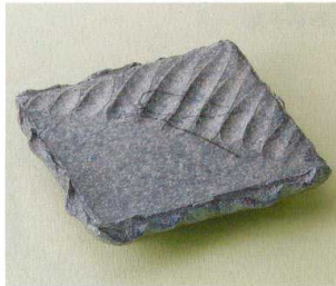
24002-436 3,300円 254320402 黒窯変そぎ足付角皿 (160×160×30mm)