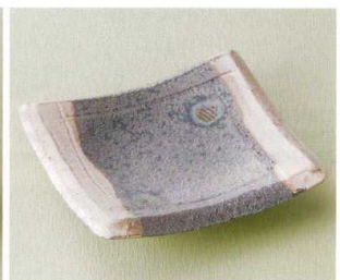
24013-436 2,640円 264324013 黒窯変掛け付け足付角小皿 (133×133×30mm)