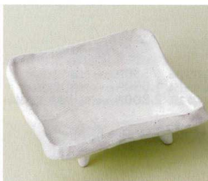
24012-406 2,650円 254003708 桜皮角皿 (170×160×43mm)