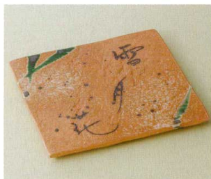
24010-036 2,800円 260324010 美濃織部雪月花正角皿 (184×176×12mm)