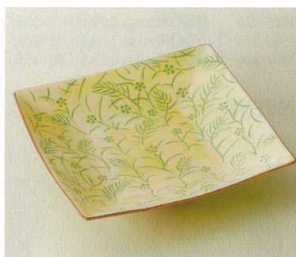
24008-226 2,870円 252220411 黄交趾若草角和皿 (150×150×39mm)