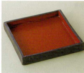
24003-086 3,200円 250820405 ジャパネスク正角銘々皿 (158×158×25mm)