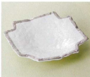
24018-286 2,300円 262820505 プラチナ四ツ切皿 (175×175mm)