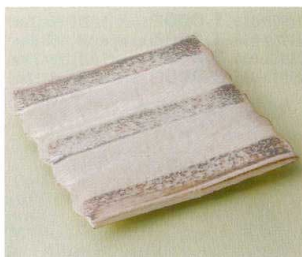
24006-436 2,200円 254320407 粉引流4.6足付角皿 (137×129×20mm) 24007-436 3,080円 254320408 粉引流5.7足付角皿 (170×160×17mm)