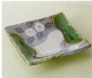
24001-086 5,200円 260824001 織部椿四方皿 (170×170×40mm)