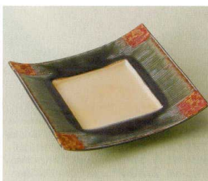
24016-056 2,500円 250520420 織部筋正角皿 (170×170×36mm)