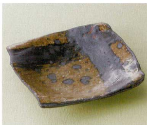
24011-226 2,660円 262224011 灰唐津6寸角皿 (168×158×40mm)