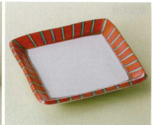
24004-406 3,200円 254020406 赤十草四方皿 (160×160×27mm)