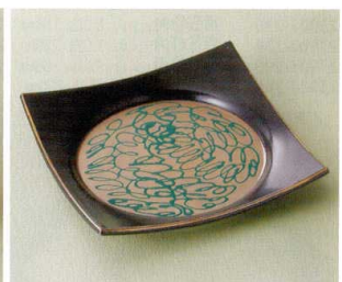
24009-186 2,800円 251820410 黒釉金緑彩前菜皿 (170×170×33mm)