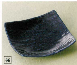
24119-376 1,600円 253720523 紺化粧四方皿 (160×160×25mm)