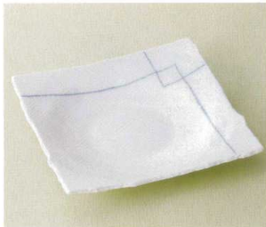
24105-036 2,100円 260324105 ブルーラインちぎり角皿 (178×175×31mm)