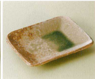
24113-436 1,950円 264324113 灰釉5.5長角皿 (160×135×20mm)