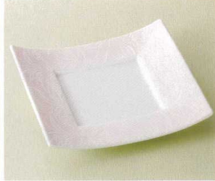
24103-076 2,100円 250702804 ピンクラスター正角皿 (168×35mm)