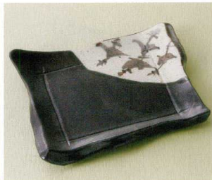
24116-186 1,750円 261824116 黒織部モダンカット5.5角皿 (160×140×28mm)