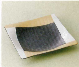
24107-286 2,000円 262824107 二色コンビ正角皿 (175×175×25mm)