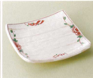
24106-026 2,030円 260224106 手描赤絵花角皿 (180×180×36mm)