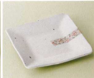
24117-286 1,690円 252820511 赤絵唐草四方皿 (165×165mm)