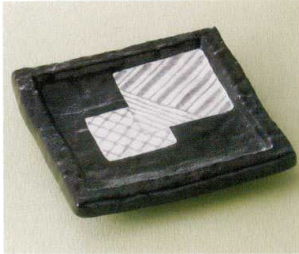
24101-136 2,150円 251302814 黒織部砂目5.5皿 (170×170×34mm)