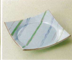
24104-186 2,100円 251820501 流し十草前菜皿 (175×175×30mm)