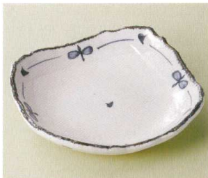
24114-286 1,900円 252820519 かいらぎ5.5角皿 (175×175mm)