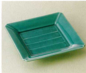
24112-186 1,950円 251820508 織部調正角皿 (170×170×30mm)