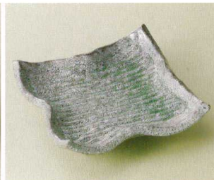
24115-236 1,900円 252320517 かいらぎ四方上り皿 (158×158×44mm)