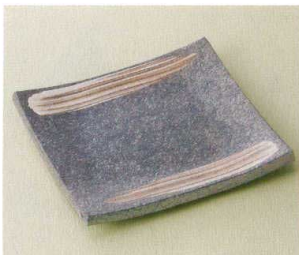
24118-436 1,650円 264324118 黒窯変刷毛目5.0角皿 (150×150×15mm)