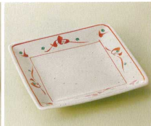
24122-166 1,350円 261624122 粉引赤絵5.0正角皿 (168×168×24mm)