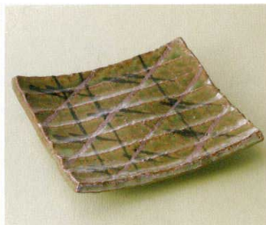
24120-136 1,430円 251320513 灰釉格子正角5.0皿 (160×160×25mm) 24121-136 1,580円 251320514 灰釉格子正角6.0皿 (173×173×25mm)