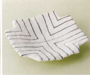
24102-226 2,130円 252202908 四切筋和皿 (178×178×30mm)