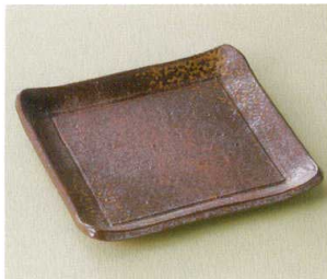
24109-216 2,000円 252117410 備前風5.0正角皿 (150×150×25mm)