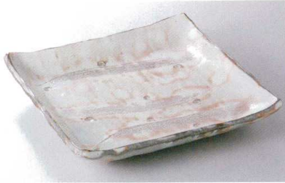
24301-216 13,900円 252121204 粉引小花四方皿(大) (260×260×55mm)