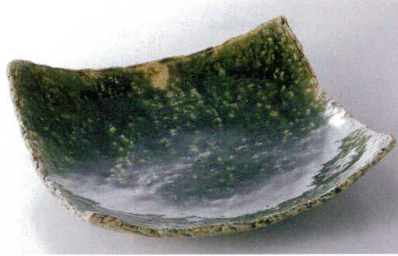
24302-376 12,000円 263724302 総織部ちぎり四角盛込皿 (260×260×75mm)