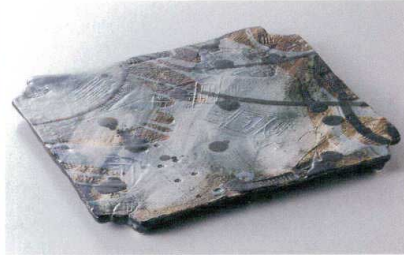
24311-226 6,920円 262224311 十字板皿ゲタ足付 (274×274×23mm)