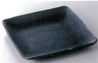
24312-436 6,300円 264324312 炭化比8.0正角皿 (240×240×30mm)