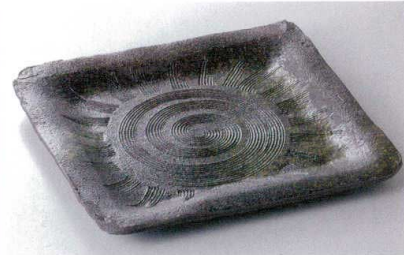
24314-086 6,500円 260824314 櫛目ビードロ正角皿 (250×250×18mm)