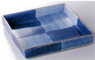
24305-306 10,000円 253021202 市松角盛皿 (260×260×45mm)