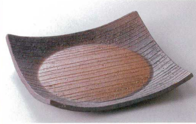
24303-316 3,500円 263124303 焼締正角6.0皿 (183×183×40mm) 24304-316 10,000円 263124304 焼締正角8.0皿 (253×253×42mm)