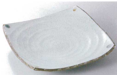
24315-036 2,700円 260324315 かいらぎ水玉四ツ足角皿(中) (195×188×36mm) 24316-036 6,800円 260324316 かいらぎ水玉四ツ足角皿(大) (272×262×43mm)