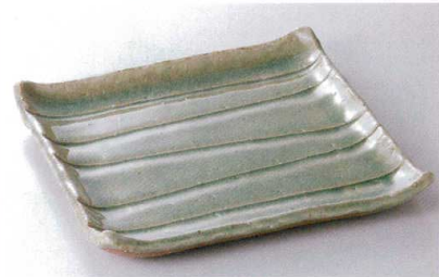
24307-316 7,600円 253120706 伊賀灰釉8.5正角皿 (250×250×33mm)