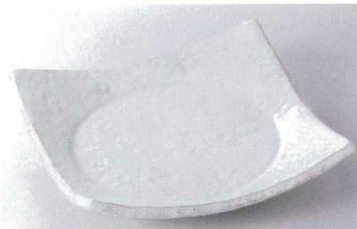
24317-336 6,000円 253320803 粉引正角皿(大) (220×220×50mm)