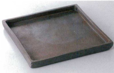
24308-436 4,280円 254320703 炭化比6.0角皿 (180×180×25mm) 24309-436 7,600円 254320704 炭化比8.0角皿 (240×240×25mm)