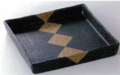
24318-106 5,900円 251020802 金耀正角7寸鉢 (220×220×33mm)