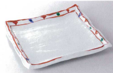
24313-286 6,730円 252820801 赤線緑紋正角皿 (260×260mm)