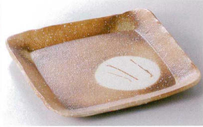
24504-436 4,000円 254320902 焼ペ火タスキ8.0角皿 (245×245×30mm)