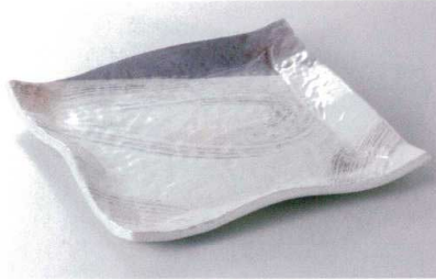
24501-336 4,150円 253321305 白灰流角盛皿 (265×265×35mm)