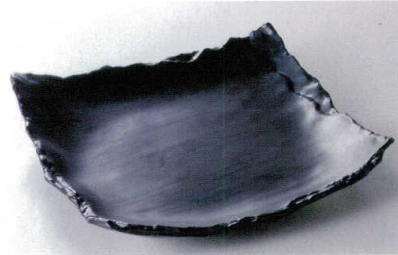
24519-086 1,050円 250821005 黒マット重ね5.5皿 (154×154×28mm) 24520-086 3,600円 250821020 黒マット重ね8.5皿 (240×240×43mm)