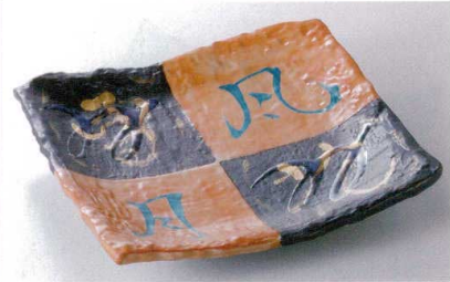
24515-306 3,750円 253021001 雪月花前菜皿 (240×240×40mm)