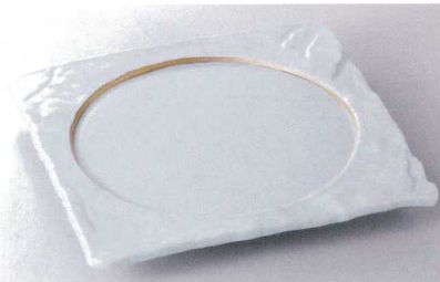
24512-166 4,000円 251621303 石割金彩正角皿 (252×252×30mm)