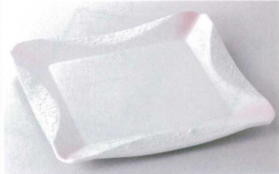
24510-186 2,600円 261824510 ラスターピンク正角和皿 (182×182×20mm) 24511-186 4,000円 261824511 ラスターピンク正角大皿 (250×250×20mm)