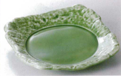
24521-126 2,200円 261224521 ヒスイ7寸四方皿 (208×208×41mm) 24522-126 3,600円 261224522 ヒスイ9寸四方皿 (245×245×46mm)