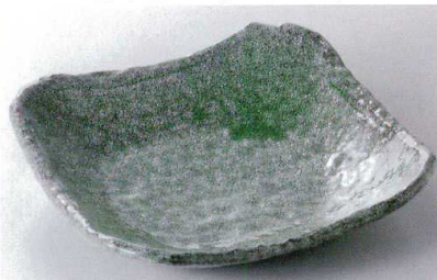
24524-236 3,600円 262324524 かいらぎ四方皿 (215×215×53mm)