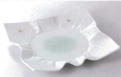
24513-476 2,800円 254720811 ラスター紙ナベ形正角中皿 (210×210×30mm) 24514-476 3,800円 254720812 ラスター紙ナベ形正角大皿 (265×265×45mm)