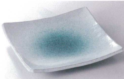
24505-326 3,800円 253221306 新緑10.0正角皿 (265×265×42mm)