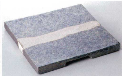
24525-436 3,520円 264324525 黒窯変一文字6.3角皿 (190×190×15mm)