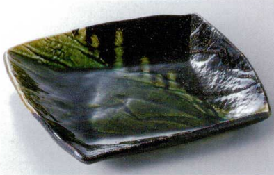
24802-306 1,200円 263024802 織部ビードロ流し6.5角皿(190×186×32mm) 24803-306 2,400円 263024803 織部ビードロ流し8.5角皿(240×233×30mm)