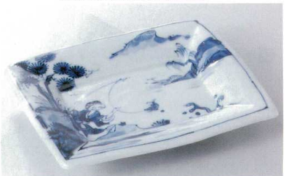
24820-186 2,200円 251820563 古染釣人角和皿(180×160×25mm)