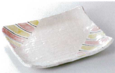
24814-326 2,280円 263224814 彩時空・風9.0正角皿(235×207×33mm)