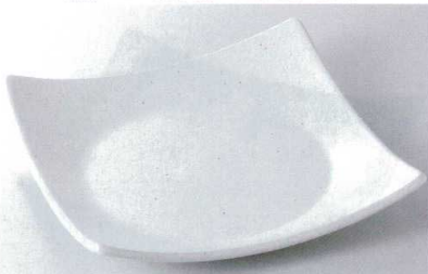
24806-266 620円 252620922 陶の里角皿(小)(150×150×28mm) 24807-266 1,420円 252620923 陶の里角皿(中)(205×205×35mm) 24808-266 2,350円 252620924 陶の里角皿(大)(245×245×48mm)