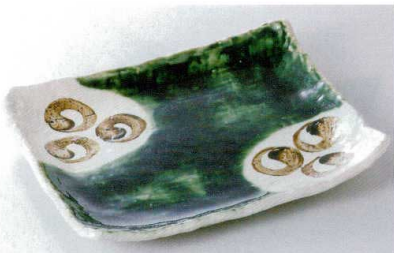
24815-326 2,250円 253221608 おひべ丸正角皿(235×207×33mm)