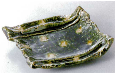
24805-076 2,400円 250720416 織部黄瀬戸小紋6.5角皿(182×42mm)