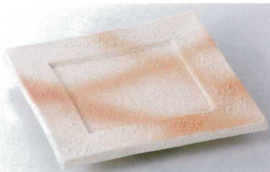
24819-186 2,200円 261824819 伊賀火だすきスクエア皿(185×185×30mm)