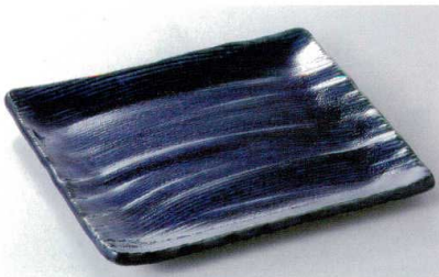
24818-456 2,200円 254520921 藍彩華波彫正角皿(210×210×20mm)