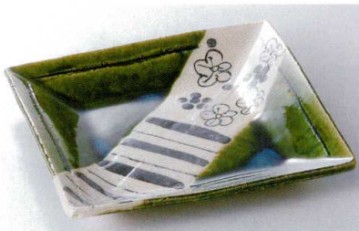
24811-306 2,300円 253020413 織部正角梅絵皿(190×190×25mm)