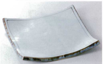
24816-156 1,180円 251520816 洸筋5.0正角皿(155×155×15mm) 24817-156 2,200円 251520817 洸筋7.0正角皿(205×205×30mm)