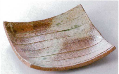
24804-356 2,400円 263524804 ビードロそぎ正角皿手づくり(200×200×30mm)