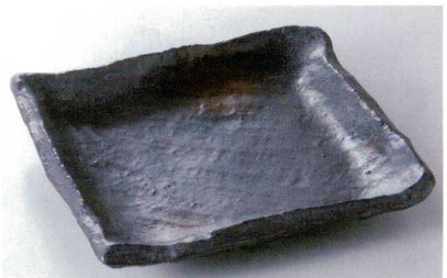
24812-036 1,100円 250321101 黒備前足付18cm正角皿(180×180×35mm) 24813-036 2,300円 250321102 黒備前足付22.5cm正角皿(225×225×40mm)