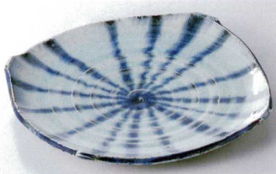
24801-316 2,430円 263124801 御深井十草7.5皿(215×213×29mm)