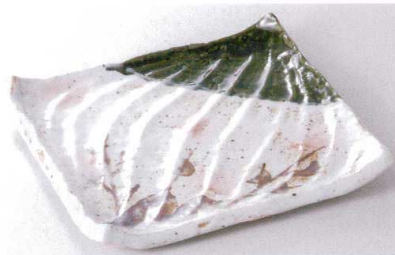
24905-136 1,800円 251321015 オリベ古木正角皿 (小) (195×195×25mm) 24906-136 2,150円 251321016 オリベ古木正角皿 (大) (218×218×25mm)