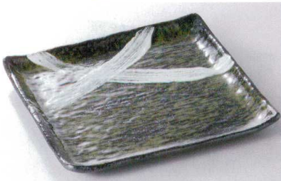
24921-026 1,890円 250221014 黒袖白刷毛木肌正角皿 (239×236×21mm)