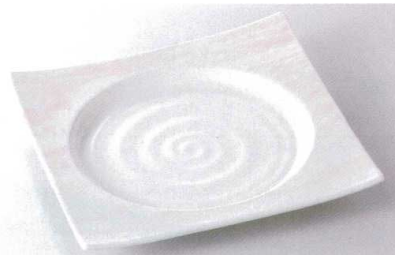
24920-186 1,900円 261824920 夕雲19cmリム角皿 (195×30mm)