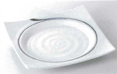
24922-166 930円 261624922 一筆15cm角皿 (155×155×20mm) 24923-166 1,350円 261624923 一筆17cm角皿 (177×177×22mm) 24924-166 1,850円 261624924 一筆19cm角皿 (197×197×24mm)