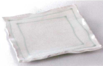
24913-156 1,550円 261524913 粉引緑線四方皿 (中) (198×198×24mm) 24914-156 2,100円 261524914 粉引緑線四方皿 (大) (232×232×27mm)