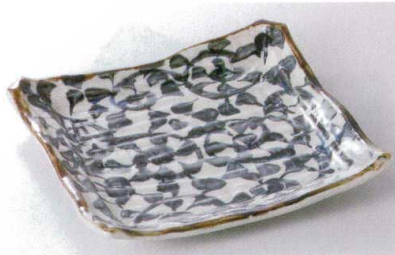
24917-256 1,350円 262524917 手描タコ唐草正角皿小 (185×185×30mm) 24918-256 1,980円 262524918 手描タコ唐草正角皿中 (218×218×35mm)