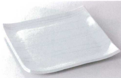
24907-226 1,860円 262224907 カラーストライプ角皿 (中) (184×184×14mm) 24908-226 2,130円 262224908 カラーストライプ角皿 (大) (230×230×19mm)