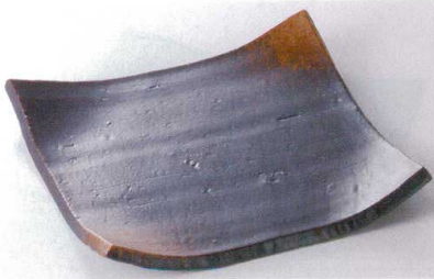
24901-156 1,180円 251521018 焼締5.0正角皿 (155×155×23mm) 24902-156 2,200円 251521019 焼締7.0正角皿 (205×205×30mm)