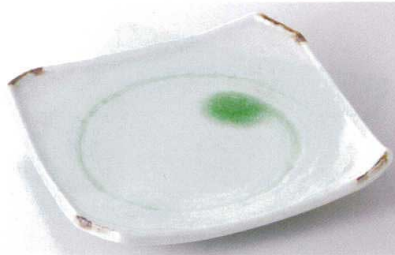
24911-056 1,000円 260524911 鳴門角5.0皿 (160×160mm) 24912-056 2,100円 260524912 鳴門角7.0皿 (215×215mm)