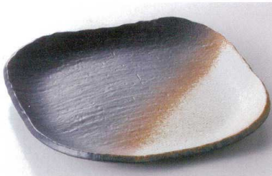
24916-316 2,250円 253121103 夜明け盛皿 (248×248×31mm)