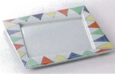
24903-186 2,150円 251820502 剣先正角前菜皿 (180×180×16mm)