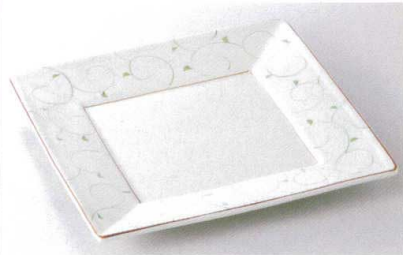
24909-216 1,300円 252120818 唐草13cm角皿 (135×135×20mm) 24910-216 2,200円 252120819 唐草21cm角皿 (210×210×25mm)