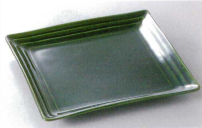
24919-026 1,940円 260224919 織部段付角大皿 (230×230×25mm)