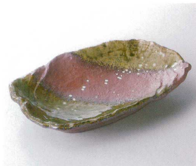
02508-356 600円 253515413 ビードロ変形皿 (小) (165×125×20mm) 02509-356 1,500円 253515414 ビードロ変形皿 (中) (260×175×35mm) 02510-356 2,700円 253515415 ビードロ変形皿 (大) (315×220×45mm)