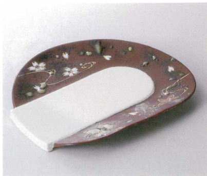
02504-186 3,000円 261802504 金流水変形前菜皿 (225×205×25mm)