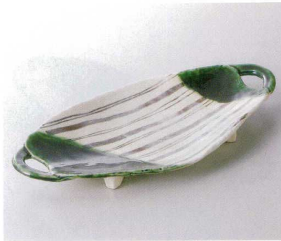
02505-186 2,800円 251822312 織部間道縮手付尺2皿 (355×185×37mm)