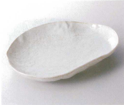
02501-166 3,000円 261602501 チタンマット盛皿 (320×233×50mm)