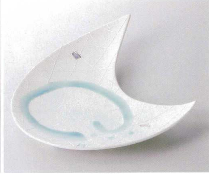
02503-036 3,000円 260302503 ラスター三日月宝石柄盛皿 (250×240×44mm)