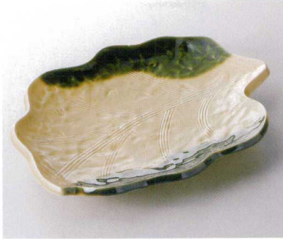
02502-286 3,000円 262802502 黄瀬戸織部葉形盛鉢 (310×255×43mm)