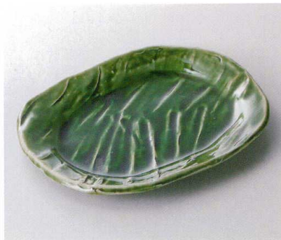
02511-186 2,700円 251822307 織部楕円型波彫和皿 (205×175×22mm)