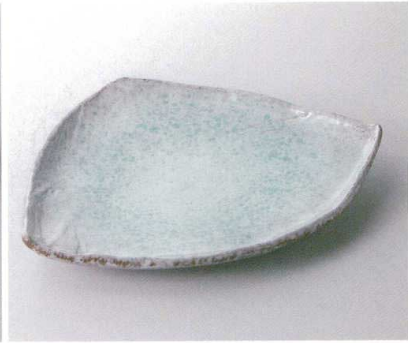
02506-486 1,000円 264802506 青袖8.0三方皿 (中) (240×205×35mm) 02507-486 2,800円 264802507 青袖10.0三方皿 (大) (335×270×45mm)