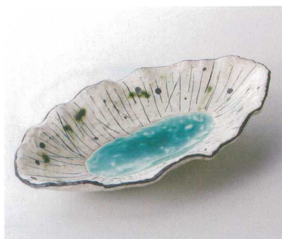
02513-186 2,700円 261802513 雨音楕円皿 (270×160×48mm)