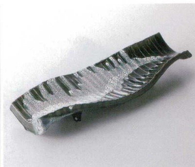
02514-136 2,650円 261302514 カイラギうねり串目尺皿 (340×138×55mm)