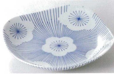
25112-206 850円 262025112 梅十草7.0四方皿 (207×207×40mm)