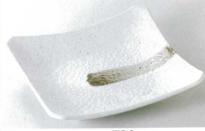
25117-306 720円 263025117 白釉正角皿 (中) (195×40mm)