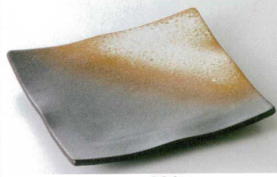
25113-316 920円 253120617 夜明け四角皿 (中) (185×185×28mm)