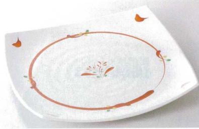
25102-176 500円 261725102 赤絵丸紋4.5正角皿 (140×140×22mm) 25103-176 1,300円 261725103 赤絵丸紋8.0正角皿 (227×227×30mm)