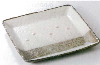
25106-286 1,160円 252851561 野花角皿 (195×195mm)