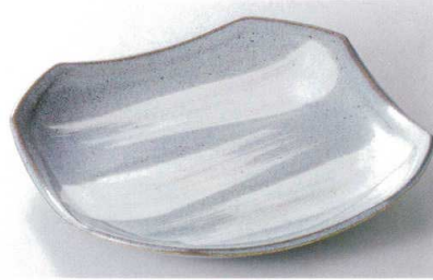
25114-026 520円 250221120 グレー刷毛目京四方6.5皿 (184×184×42mm) 25115-026 830円 250221121 グレー刷毛目京四方8.0皿 (220×220×35mm)