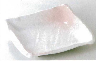
25110-056 1,000円 250520610 ピンク吹正角皿 (190×190×35mm)