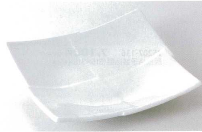
25109-256 1,050円 252520604 青地市松彫6.0角皿 (185×37mm)