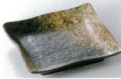
25116-276 740円 252721119 備前吹正角7.0皿 (180×180×37mm)