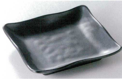
25111-166 900円 251620613 鉄結晶四方皿 (184×184×33mm)