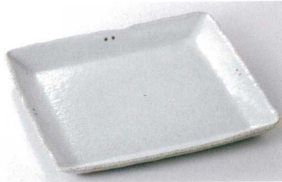
25101-406 1,300円 264025101 辰砂正角皿 (198×198×20mm)