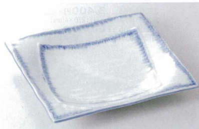
25105-076 1,250円 260725105 ゴス線正角皿 (182×25mm)