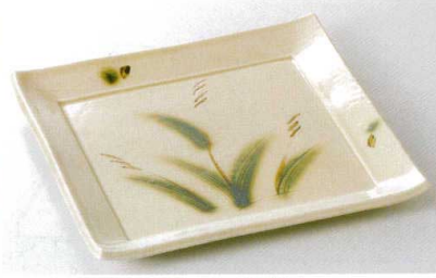
25104-156 1,260円 251520520 黄瀬戸スキ6.0正角皿 (187×20mm)