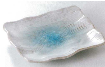
25108-226 1,060円 262225108 吹ブルー足付角皿 (192×180×37mm)