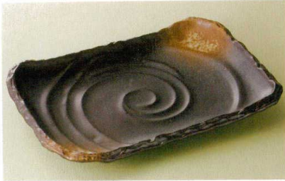
25501-476 2,900円 264725501 備前 盛皿(小) (250×200×32mm) 25502-476 4,950円 264725502 備前 盛皿(大) (330×235×45mm)