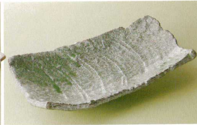
25516-186 3,200円 261825516 かいらぎ四ツ足盛皿 (300×170×65mm)