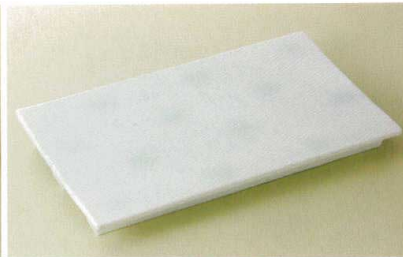
25512-336 3,400円 263325512 青磁市松彫長皿大 (310×200×30mm)