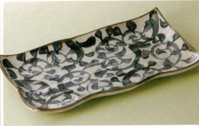
25513-256 3,380円 262325513 タコ唐草長角大皿 (355×195×40mm)