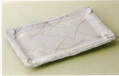
25509-076 3,600円 260725509 炭化土金彩粉引長角9.5寸皿 (203×290×22mm)