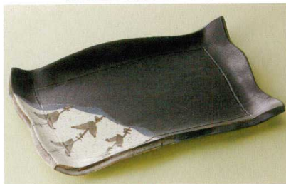
25505-186 4,200円 251821706 黒織部モダンカット10.0長角皿 (295×215×30mm)