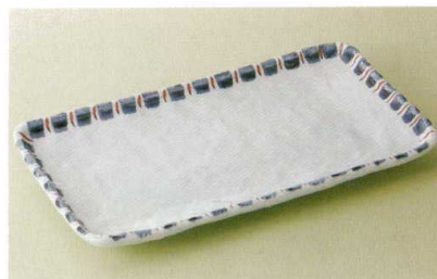
25514-416 3,360円 254121709 トクサ長角大皿 (315×180×30mm)