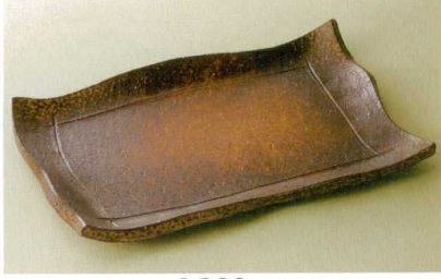
25504-186 4,200円 251821508 備前風モダンカット10.0長角皿 (295×215×30mm)