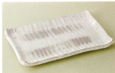
25511-186 3,500円 251821405 粉引波彫長角盛皿 (260×170×30mm)