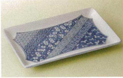
25503-416 4,500円 264125503 祥瑞花長角尺2皿 (320×220mm)