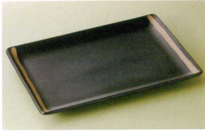
25507-416 4,200円 254121703 黒マット一本線長角尺二皿 (320×220×30mm)