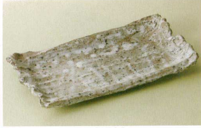
25510-086 3,500円 250821410 乾山土灰27cm長角皿 (278×168×45mm)