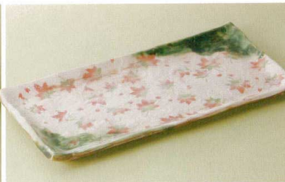
25515-106 3,250円 251021411 色彩春秋長角大皿 (360×175×23mm)