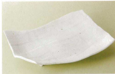
25508-026 3,840円 250221509 布目流水角大皿 (299×220×49mm)