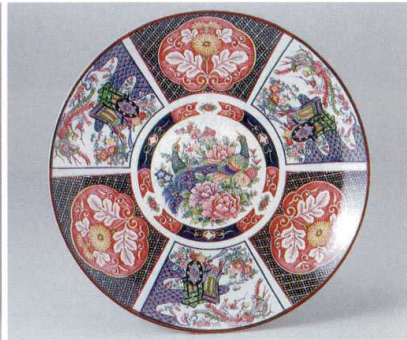
25821-356 2,300円 263525821 伊万里御所車10.0大皿 (320×38mm) 25822-356 4,000円 263525822 伊万里御所車12.0大皿 (385×46mm) 25823-356 6,000円 263525823 伊万里御所車13.0大皿 (410×50mm)