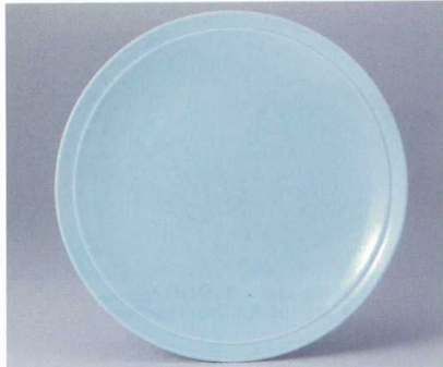
25801-356 1,700円 263525801 青磁10.0大皿 (315×40mm) 25802-356 2,400円 263525802 青磁12.0大皿 (380×50mm)