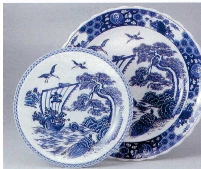
25824-486 1,350円 264825824 宝舟10.0丸皿 (320×35mm) 25825-486 2,350円 264825825 宝舟12.0丸皿 (370×40mm) 25826-486 3,850円 264825826 宝舟13.0雪輪皿 (420×55mm)