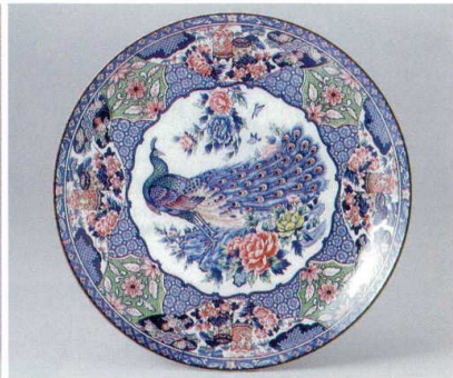
25812-356 1,800円 263525812 孔雀10.0皿 (φ320×35mm)