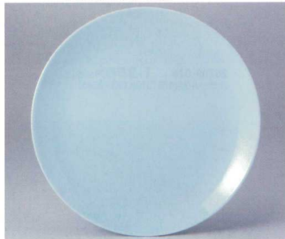
25813-486 1,350円 264825813 青地10.0丸皿 (320×35mm) 25814-486 2,100円 264825814 青地11.0丸皿 (340×40mm) 25815-486 2,300円 264825815 青地12.0丸皿 (370×45mm) 25816-486 3,850円 264825816 青地13.0丸皿 (425×50mm) 25817-486 8,500円 264825817 青地15.0丸皿 (480×45mm)