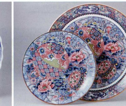
25827-356 1,700円 263525827 手まり牡丹10.0大皿 (320×35mm) 25828-356 2,300円 263525828 手まり牡丹12.0大皿 (365×45mm) 25829-356 4,300円 263525829 手まり牡丹13.0大皿 (410×55mm)