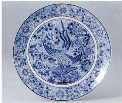
25810-356 1,800円 263525810 鳳凰10.0皿 (φ320×35mm) 25811-356 2,400円 263525811 鳳凰12.0皿 (φ370×45mm)