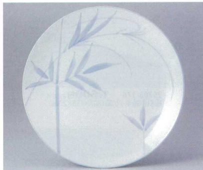
25808-356 1,300円 263525808 芦絵10.0皿 (φ315×35mm) 25809-356 2,200円 263525809 芦絵12.0皿 (φ370×45mm)