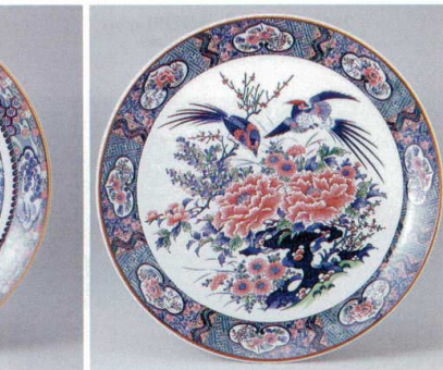
25830-486 4,500円 264825830 春日13.0丸皿 (425×50mm)