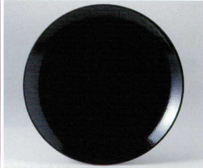
25806-356 1,600円 263525806 袖子天目10.0号丸皿 (310×35mm) 25807-356 2,100円 263525807 袖子天目12.0号大皿 (365×45mm)