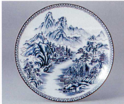
25818-486 1,400円 264825818 鈴峰山水10.0丸皿 (320×35mm) 25819-486 2,350円 264825819 鈴峰山水12.0丸皿 (380×45mm) 25820-486 3,950円 264825820 鈴峰山水13.0丸皿 (410×50mm)