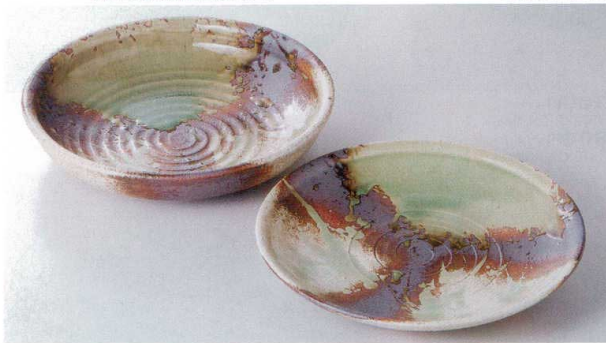
25911-356 2,100円 263525911 灰釉ピード口7.0鉢 (210×45mm) 25912-356 4,100円 263525912 灰釉ピード口9.5盛鉢 (295×65mm)