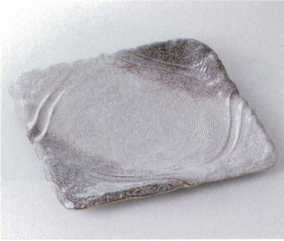
25904-486 2,650円 264825904 淡雪10.0正角皿 (305×305×40mm)