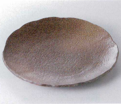
25903-486 2,200円 264825903 茶吹き10.0花形皿 (310×42mm)