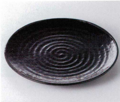
25901-486 2,500円 264825901 油滴天目10.0丸皿 (300×32mm) 25902-486 3,800円 264825902 油滴天目11.0丸皿 (336×32mm)