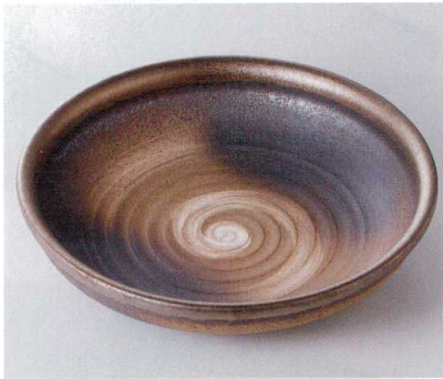
25905-356 4,100円 263525905 金彩9.5盛鉢 (295×65mm) 25906-486 1,850円 264825906 金彩7.0号めん鉢 (210×45mm)