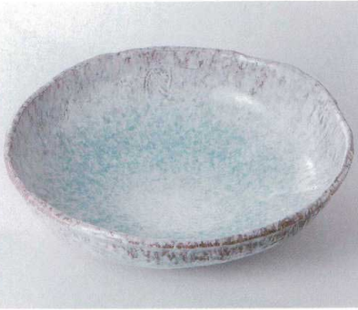
25907-486 2,300円 264825907 青釉8.0盛鉢 (240×68mm) 25908-486 4,700円 264825908 青釉10.0盛鉢 (295×80mm)