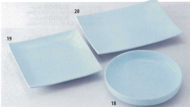
⑱ 25918-356 2,100円 263525918 青磁10.0号盛鉢 (310×60mm) ⑲ 25919-356 2,300円 263525919 青磁10.0号正角皿 (310×45mm) ⑳ 25920-356 2,800円 263525920 青磁12.0号長角皿 (390×290×50mm)