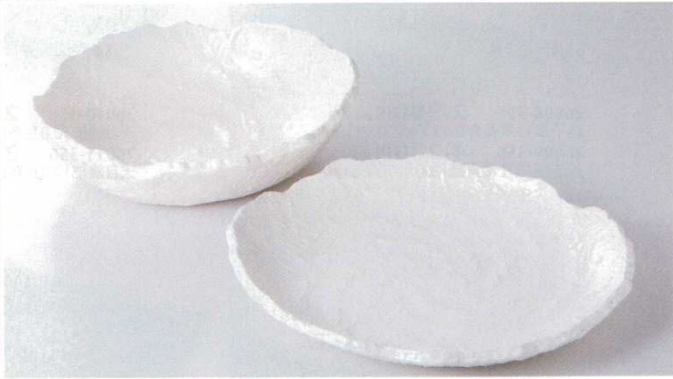
25914-486 1,400円 264825914 白地うす潮8.0盛鉢 (250×223×55mm) 25915-486 2,000円 264825915 白地うす潮10.0盛鉢 (275×242×73mm)