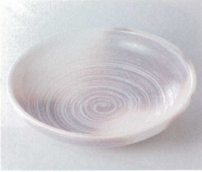
25909-486 1,900円 264825909 かすみ志野8.0めん鉢 (243×67mm) 25910-486 3,400円 264825910 かすみ志野10.0めん鉢 (296×76mm)