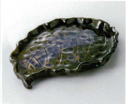
02603-476 2,600円 264702603 黒織部窯変葉型皿(大) (250×185×35mm)