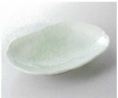
02609-056 2,450円 260502609 グリーン吹変形盛皿 (295×215×50mm)