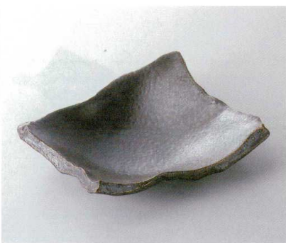
02611-086 2,400円 260802611 銀サビ黒ちぎり角皿(大) (237×207×62mm)