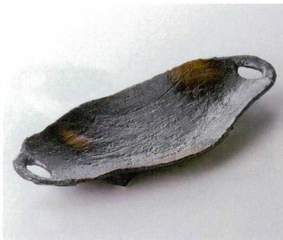
02605-036 2,500円 250323222 黒備前手付盛皿 (340×160×40mm)