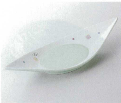
02608-186 2,450円 261802608 ジュエリー変形舟型尺一皿 (345×125×60mm)