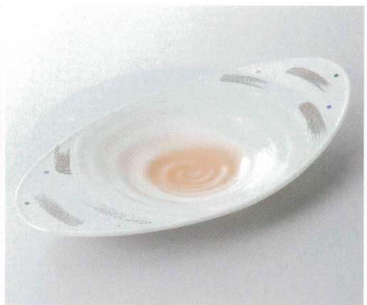
02606-126 2,600円 261202606 ラスター水玉プラチナ刷毛目楕円皿 (320×175×30mm)