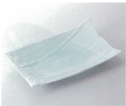
02610-226 2,450円 262202610 青白磁しぶき盛皿 (275×192×55mm)