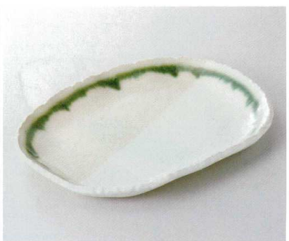
02612-156 2,350円 251515417 半掛織部流小判9.0皿 (270×210×23mm)