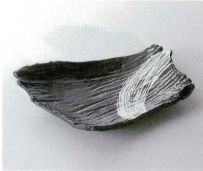
02602-476 2,600円 264702602 銀河三ツ足前菜皿 (235×195×50mm)