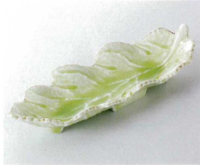
02601-236 2,600円 252315416 ヒワ軸葉型大長皿 (317×115×55mm)