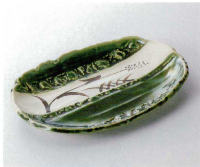
02604-316 2,550円 253115419 織部芦画小判8.5皿 (267×193×32mm)