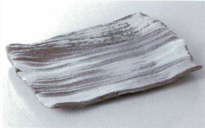
26004-486 2,400円 264826004 雪志野10.0長角皿 (320×230×33mm)