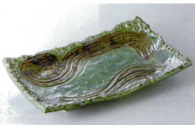
26015-486 1,900円 264826015 織部10.0四ッ足長角皿 (328×197×50mm) 26016-486 3,000円 264826016 織部12.0四ッ足長角皿 (378×245×60mm)