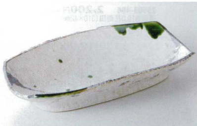
26006-486 2,000円 264826006 織部流線10.0長角盛皿 (310×185×55mm)