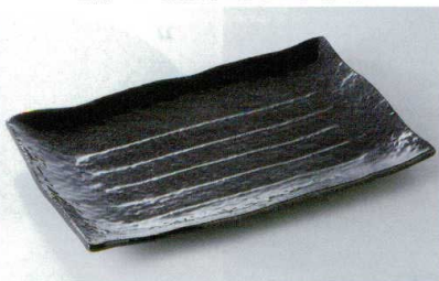
26023-486 1,650円 264826023 油滴天目9.0長角皿 (282×183×30mm) 26024-486 2,200円 264826024 油滴天目10.0長角皿 (300×210×33mm) 26025-486 2,750円 264826025 油滴天目11.0長角皿 (343×235×35mm) 26026-486 3,800円 264826026 油滴天目12.0長角皿 (375×265×38mm)