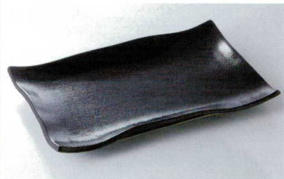
26012-356 2,300円 263526012 天目11.0長角皿 (335×230×30mm) 26013-356 4,200円 263526013 天目13.0長角皿 (390×270×40mm)