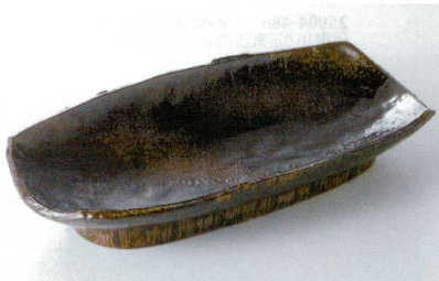
26005-486 2,000円 264826005 琥珀10.0長角盛皿 (310×185×55mm)