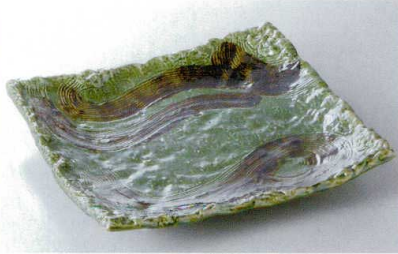
26002-486 1,550円 264826002 織部8.0四ッ足正角皿 (260×260×55mm) 26003-486 2,350円 264826003 織部10.0四ッ足正角皿 (310×310×53mm)