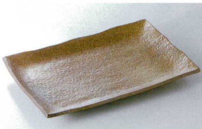
26019-356 1,000円 263526019 南蛮7号長角皿 (220×150×25mm) 26020-356 2,000円 263526020 南蛮10.0号長角皿 (315×215×35mm) 26021-356 2,600円 263526021 南蛮11.0号長角皿 (340×235×40mm) 26022-356 3,100円 263526022 南蛮12.0号長角皿 (375×265×40mm)