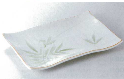
26014-486 2,400円 264826014 グリーン笹11.0長角皿 (335×235×40mm)