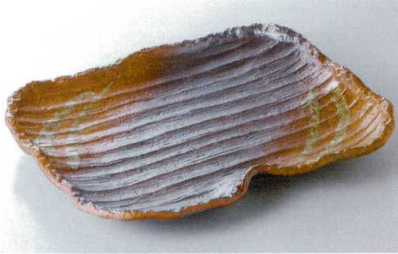
26001-486 4,600円 264826001 南蛮一珍12.0角大皿 (370×310×47mm)