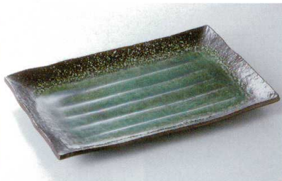
26010-356 2,100円 263526010 天目織部10.0長角皿 (300×210×30mm) 26011-356 3,800円 263526011 天目織部12.0長角皿 (370×260×40mm)