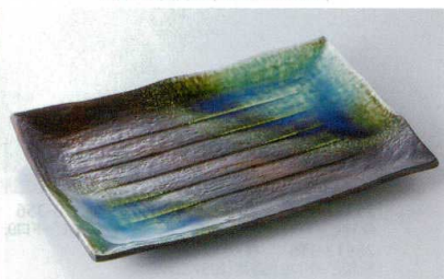
26017-356 2,200円 263526017 窯変織部10.0長角皿 (300×210×30mm) 26018-356 3,900円 263526018 窯変織部12.0長角皿 (370×260×30mm)