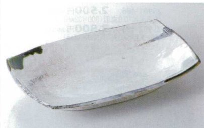
26007-486 3,600円 264826007 織部流線11.0長角盛皿 (335×235×50mm)