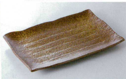
26027-486 1,650円 264826027 備前風9.0長角皿 (282×183×30mm) 26028-486 2,200円 264826028 備前風10.0長角皿 (300×210×33mm) 26029-486 2,750円 264826029 備前風11.0長角皿 (343×235×35mm) 26030-486 3,800円 264826030 備前風12.0長角皿 (375×265×38mm)