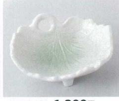
26310-186 1,200円 261826310 ヒワスター葵鉢 (122×117×42mm)