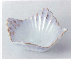
26313-166 1,050円 251625724 金たたき菊型小鉢 (106×106×47mm)