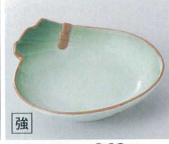
強 26319-326 960円 253226010 緑彩袋型松華堂 (113×112×36mm)