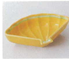
26311-306 1,100円 253026016 黄釉線線扇面鉢 (150×102×37mm)