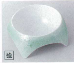
強 26302-326 1,450円 263226302 ヒワ吹四ツ足小鉢 (110×110×43mm)