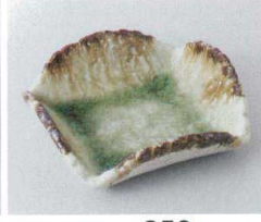
26315-086 950円 250826009 灰釉流四折鉢 (113×113×33mm)