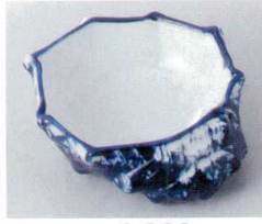
26308-226 1,280円 252225902 サザエ(大) (105×40mm)