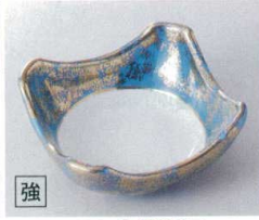
強 26303-326 1,800円 252225705 金彩輪花松華堂 (110×110×44mm)