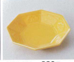
26325-086 880円 250816416 黄釉八角皿 (120×115×25mm)