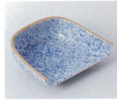
26316-156 1,100円 251526011 口金黒吹み形小鉢 (115×105×38mm)