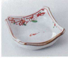
26304-036 1,050円 250325715 赤絵万層四角松花堂 (110×110×38mm)