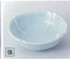
強 26327-316 840円 253126022 青白磁スミ切浅小鉢 (116×111×36mm)