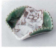
26314-186 1,100円 251825819 織部山草花角鉢 (112×35mm)