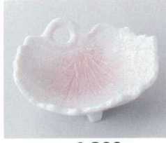
26309-186 1,200円 261826309 ピンクスター葵鉢 (122×117×42mm)