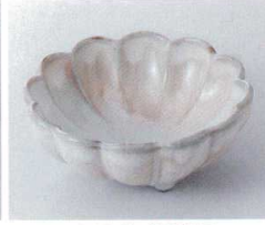
26318-286 1,000円 252825820 御本手三ツ足小鉢 (112×40mm)