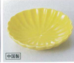
中国製 26329-166 380円 251626132 黄釉菊型皿 (110×25mm)