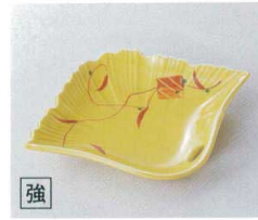
強 26321-456 1,100円 264526321 黄釉銀杏銘々皿 (115×115)