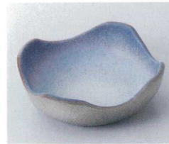
26326-326 860円 253225823 青雲正角鉢 (110×110×40mm)