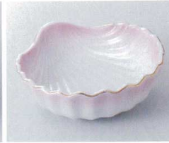
26328-136 830円 251326023 ピンク吹貝型鉢 (120×115×35mm)