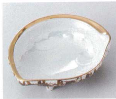
26301-226 1,920円 252226005 あわび鉢 (122×105×33mm)