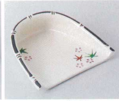
26317-126 950円 251226012 春秋ミノ形小鉢 (115×115×35mm)