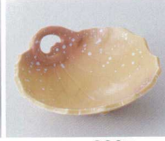
26324-186 900円 251826018 マロン吹木の葉皿 (125×118×38mm)