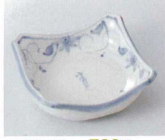
26305-056 700円 250526027 唐草角松花堂 (110×110×38mm)