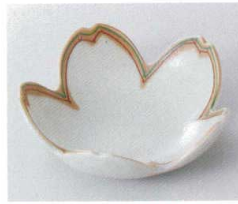
26306-186 1,450円 251826006 赤グリーン線桜型小鉢 (112×34mm)