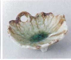
26323-086 950円 250826019 灰釉流あおい鉢 (120×115×45mm)