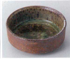
26307-186 1,300円 251825909 備前灰釉丸鉢 (101×38mm)