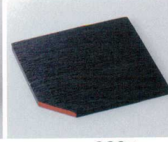
26330-406 280円 254026133 黒板 (110×110mm)