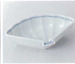
26312-286 930円 252826017 濃扇形小鉢 (147×50mm)