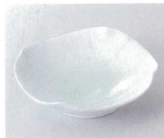
26516-086 950円 260826516 ヒワ吹四方押鉢 (115×115×30mm)