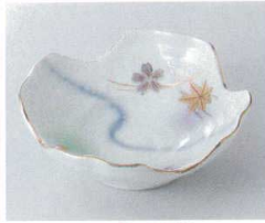
26508-086 1,050円 250825419 白吹竜田川四ツ山鉢 (119×119×45mm)