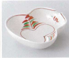
26519-036 1,000円 250325506 瓢型万暦小鉢 (112×112×33mm)