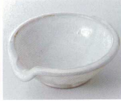
26515-136 800円 251325824 御本手くしめ片口鉢 (125×120×40mm)