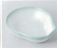
26524-186 660円 251825522 白磁グリーン吹瓢鉢 (126×108×28mm)