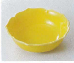
26510-056 660円 250526118 黄花粉松華堂鉢 (107×35mm)