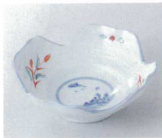
26506-086 1,200円 260826506 赤絵京山水四ツ山鉢 (119×119×45mm)