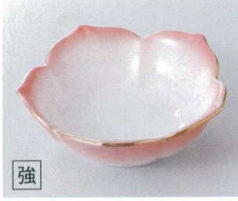
26504-316 1,350円 253126114 潤金紅吹栴檀型鉢 (107×107×35mm)