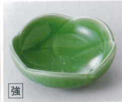
26513-456 1,000円 264526513 天竜青磁梅型鉢 (110×35mm)