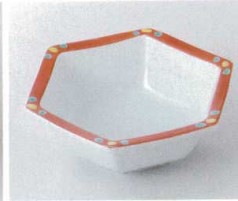
26529-456 860円 254526120 京風赤巻六角鉢 (110×35mm)