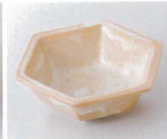
26528-406 450円 264026528 志野六角鉢 (113×100×38mm)