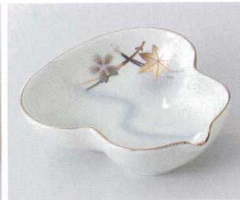
26518-086 1,050円 260826518 白吹竜田川瓢鉢 (114×112×32mm)