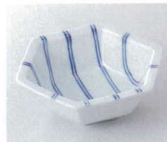
26526-126 840円 25125425 ストライプ六角鉢 (110×110×35mm)