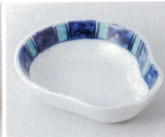
26523-186 720円 251825517 ダミ十章瓢鉢 (123×103×27mm)