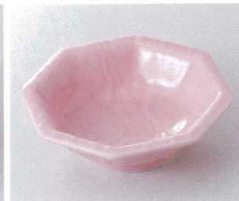
26527-406 680円 264026527 ピンク石目八角鉢 (120×110×35mm)