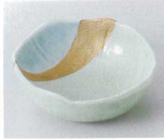
26514-186 950円 251825911 青磁ヒワ金流し平鉢 (112×108×35mm)