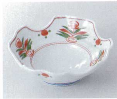
26507-306 1,050円 253025728 万曆四方切角鉢 (105×43mm)