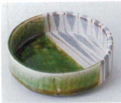
26501-406 2,400円 254025533 志野織部松華堂 (107×30mm)