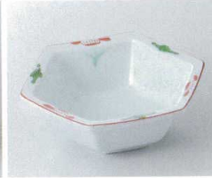
26525-406 870円 254026119 赤絵六角小鉢 (110×100×35mm)