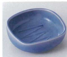
26521-186 1,100円 251826121 青釉ソギ角鉢 (112×112×35mm)