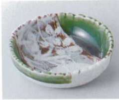
26502-186 1,100円 251825534 織部山草花丸鉢 (112×30mm)