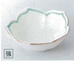
26505-326 1,300円 253226007 金緑彩栴檀形浅鉢 (105×36mm)