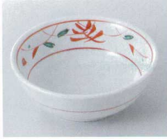
26503-186 1,250円 251825908 手書き花つなぎ丸鉢 (113×44mm)