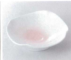
26517-086 950円 260826517 オレンジ吹四方押鉢 (115×115×30mm)