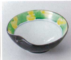
26512-136 1,300円 251326112 外黒二彩片口小鉢 (110×110×40mm)