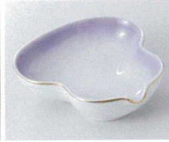
26520-136 850円 251325727 マロン吹ヒサゴ型 (112×112×33mm)