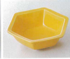
26530-406 630円 264026530 オレンジ六角鉢 (113×100×38mm)