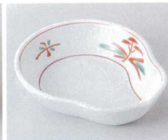
26522-126 950円 25125431 赤絵瓢子皿 (105×125×25mm)