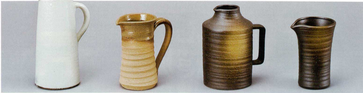
27801-436 8,500円 254327705 粉引ピッチャー(100×200mm・900cc) 27802-336 8,000円 253327702 荒土灰釉ピッチャー(85×150mm・600cc) 27803-106 2,400円 251027704 黒備前手付水差し(110×143×175mm・1050cc) 27804-106 1,380円 251027701 黒備前水差し(105×90×146mm・480cc)