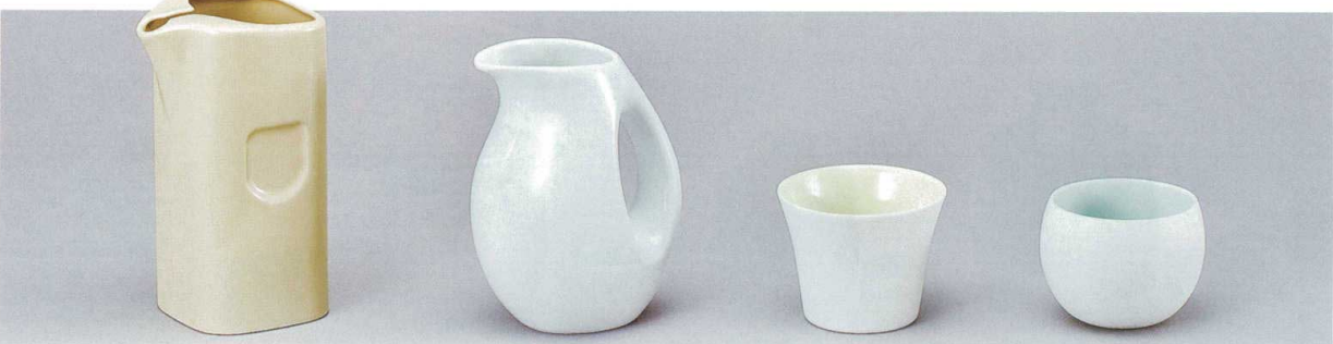
27814-166 1,380円 251660423 クリーム水差し(103×81×177mm・820cc) 27815-206 2,500円 252027703 ホワイトウォーターサーバ(120×100×150mm・720cc) 27816-076 1,300円 250727713 イエロー三角カップ(95×75mm) 27817-076 1,300円 250727714 ブルー丸カップ(83×70mm)