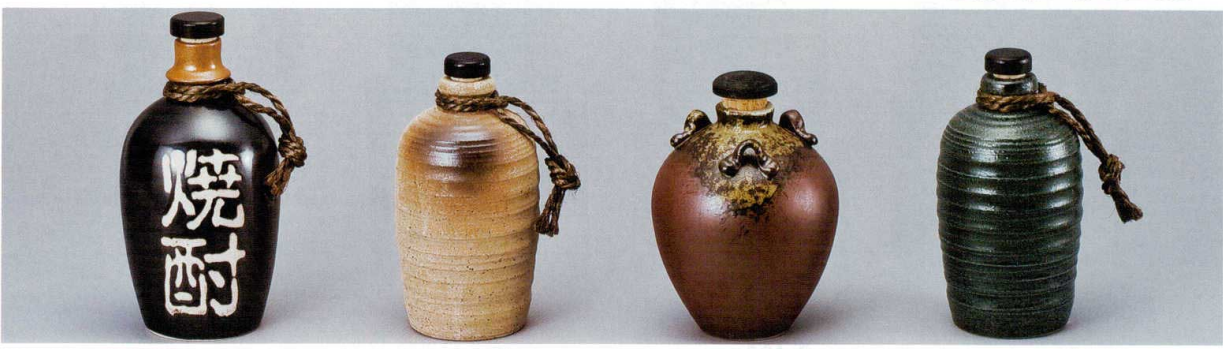
27810-106 1,800円 251027605 天目金結晶焼酎5号ボトル(115×230mm・1150cc) 27811-106 1,900円 251027608 白伊賀4合ボトル(95×200mm・800cc) 27812-106 2,200円 251027611 伊賀耳付5号ボトル(180mm・1160cc) 27813-106 1,900円 251027607 群青4号ボトル(95×200mm・800cc)