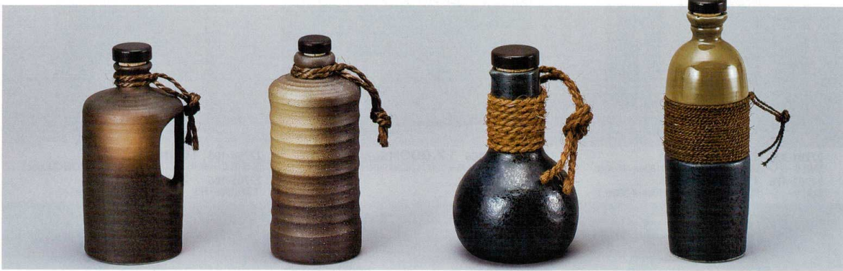
27805-106 2,400円 261027805 黒備前手付5号ボトル(φ96×H210mm・930cc) 27806-106 2,400円 251027604 黒備前ホームボトル(90×208mm・850cc) 27807-106 2,200円 251027606 藍染縄巻5号ボトル(120×200mm・900cc) 27808-106 1,900円 251027609 藍染割々4号ボトル(75×260mm・840cc) 27809-106 1,400円 251027610 藍染割々2号ボトル(65×210mm・450cc)